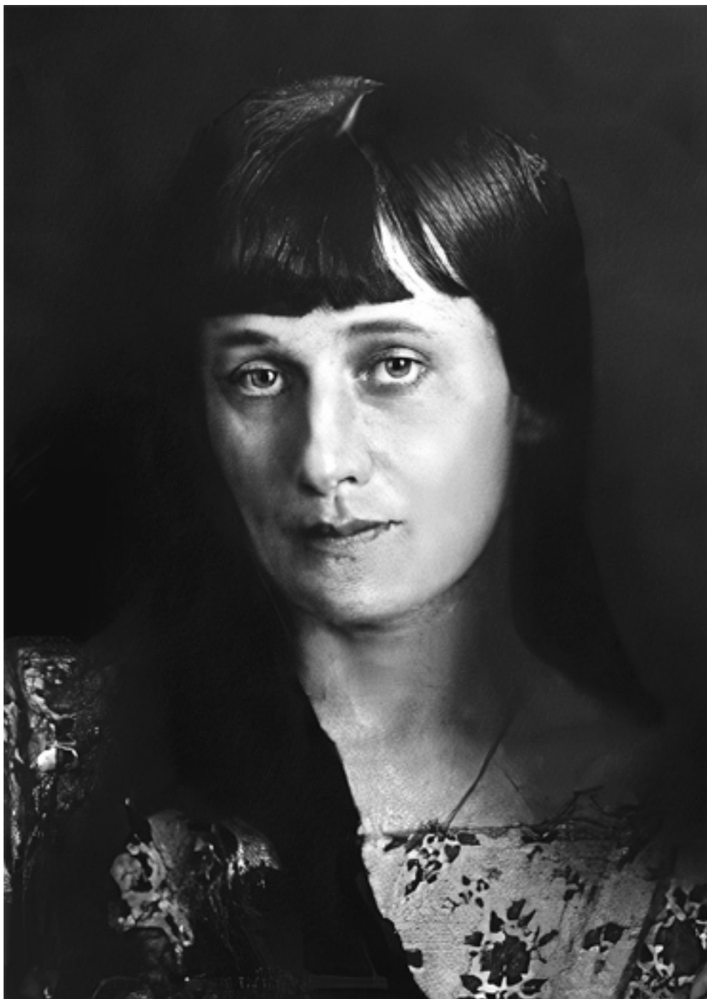
Анна Андреевна Ахматова

– Не надо, забывать, что образованность не может быть безграничной, и в каждой культуре это понятие разное. Я встречал «китайски», «персидски», «европейски» образованных людей. Для китайца быть образованным человеком – это уметь писать иероглифами, красивым почерком сочинения Конфуция, а также знать три классических романа – «Сон в красном тереме», «Троецарствие» и «Речные заводы». У древних греков образованность заключалась в умении произносить речи публично. Самыми образованными среди них были риторы или софисты. Подобные представления бытовали в Риме. У европейцев понятие «образованность» включает сейчас главным образом знание естественных наук. Но так: было не всегда, еще столетия лет назад большим приоритетом пользовались история и филология. Это относится, к примеру, ко времени Александра Дюма, широко образованного человека своего времени.