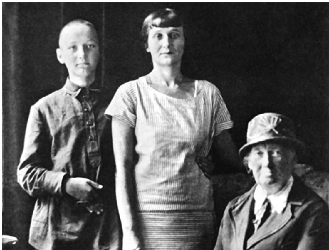
С мамой и бабушкой