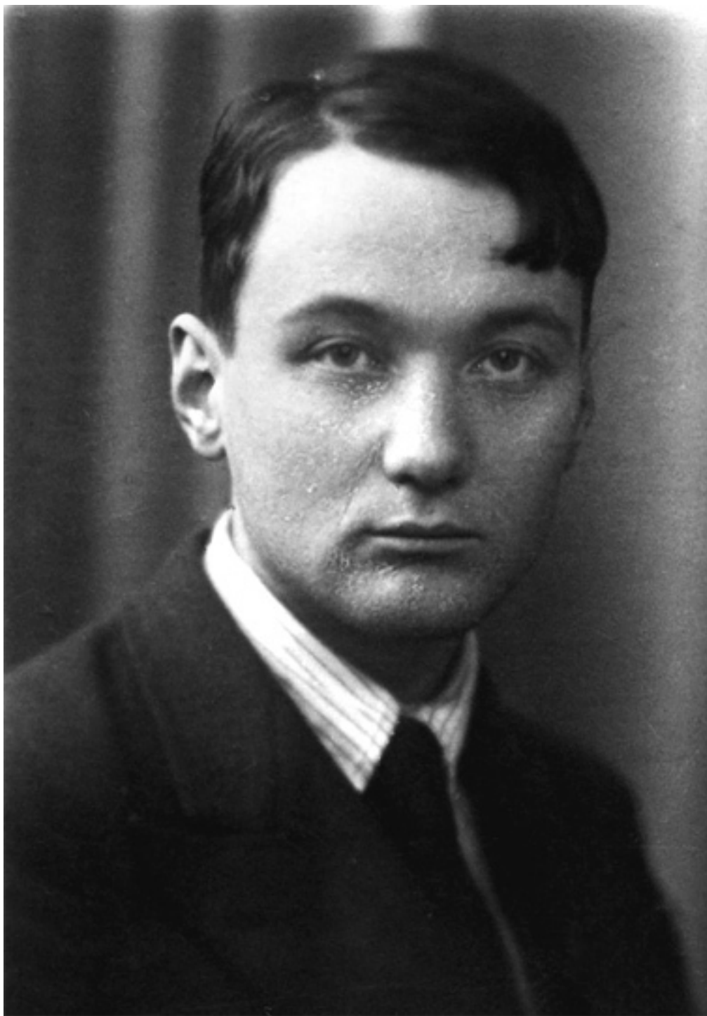
Лев Николаевич Гумилев

Область научных интересов Л. Н. Гумилева – этнология – наука, совместившая географию, биологию, историю и психологию. Его труд «Этногенез и биосфера Земли», в соответствии с решением Ученого совета ЛГУ от 30 октября 1978 года, был отпечатан тиражом в один экземпляр и депонирован во Всесоюзный институт научной и технической информации (ВИНИТИ). С тех пор с этого трехтомного трактата снята не одна тысяча копий, и вот в будущем году планируется выпуск книги. Другая работа Л. Н. Гумилева – «Древняя Русь и Великая степь» – готовится к печати в Москве, в издательстве «Мысль».