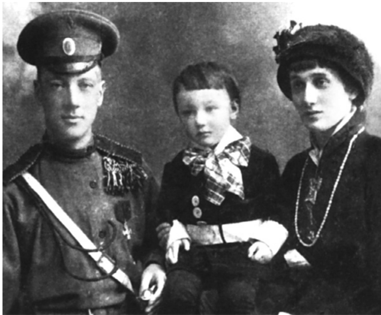
Анна Ахматова и Николай Гумилев с сыном Львом

Он создал свой мир в исторической науке, свою концепцию развития истории – с учетом географических, этнографических знаний, с применением методологии других наук. Это дорогого стоит. Сам Лев Николаевич так – несколько романтично – рассказывал об этом открытии: «Сидя в камере, я увидел, как луч света падает из окна на цементный пол. И тогда я сообразил, что пассионарность – это энергия, такая же, как та, которую впитывают растения». Сегодня этот