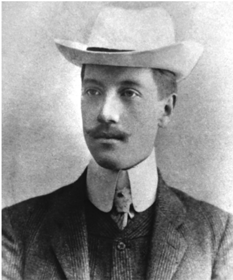
Николай Степанович Гумилев

Лидия Чуковская сетовала: «Вернувшись, я отправилась