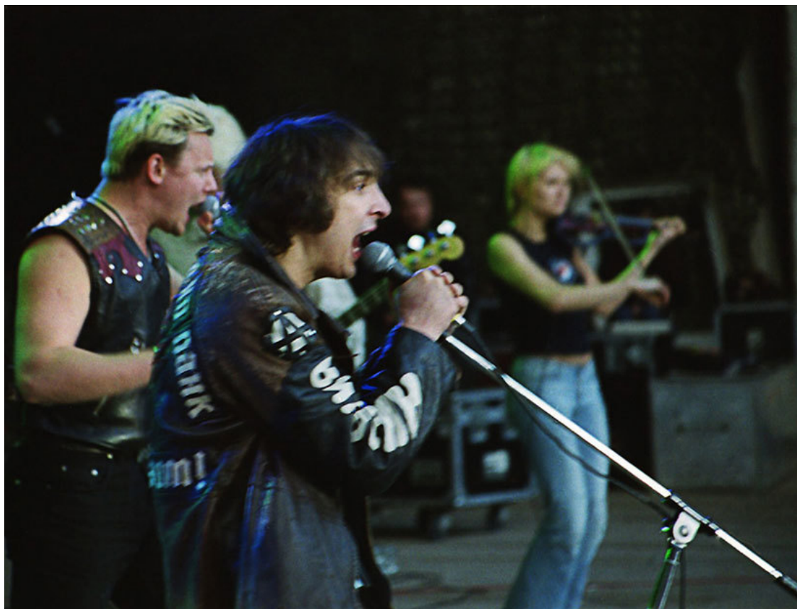
Горшок, Князь и Маша в Зеленом театре, 13 июня 2003 года.