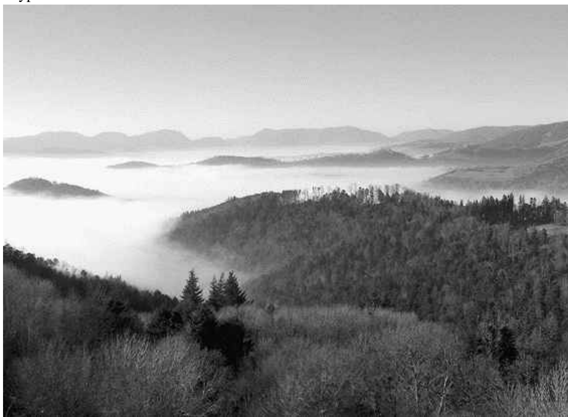
Поздней осенью долины Вогезских гор утопают в тумане

Бывалые путешественники советуют новичкам не лететь из Парижа в Эльзас на самолете. Лучше воспользоваться автомобилем, проехав по живописной дороге, петляющей среди холмов, лесных чащ, уютных городков и средневековых замков. Помехой в пути могут показаться Вогезы (франц. Vosges), но этих гор не стоит бояться, поскольку их склоны пологи, перевал невысок, и даже такие неудобства с лихвой окупаются чудесными видами. Сразу за перевалом пейзаж резко меняется: вместо редких лиственных лесов появляются густые хвойные, слегка напоминающие сибирские, жара сменяется прохладой, и даже воздух становится гуще. Проезжая мимо фахверковых стен, исчерченного незатейливым узором деревянных балок, путник понимает, что рядом Германия. Впрочем, почему же рядом? Она уже здесь, ведь не случайно здешние города имеют немецкие названия: Риквир, Туркхайм, Нидерморшвир, Кайзерсберг, Страсбург.