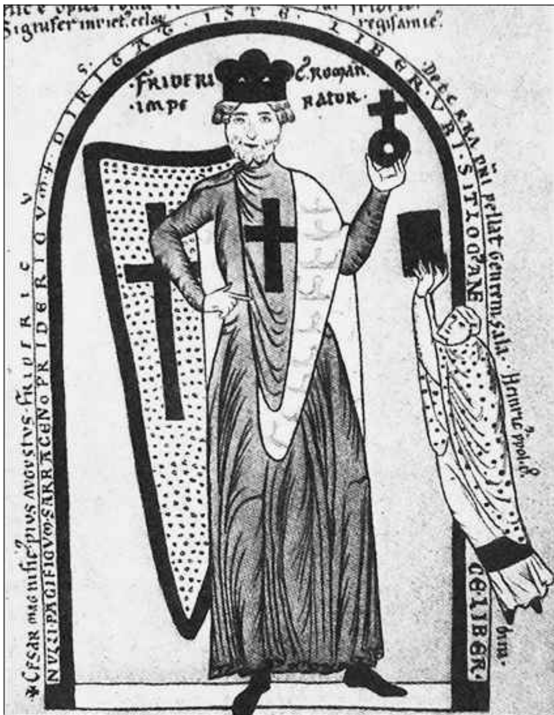
Фридрих Барбаросса не был чужд культуре, и художники платили ему благодарностью, изображая императора на миниатюрах