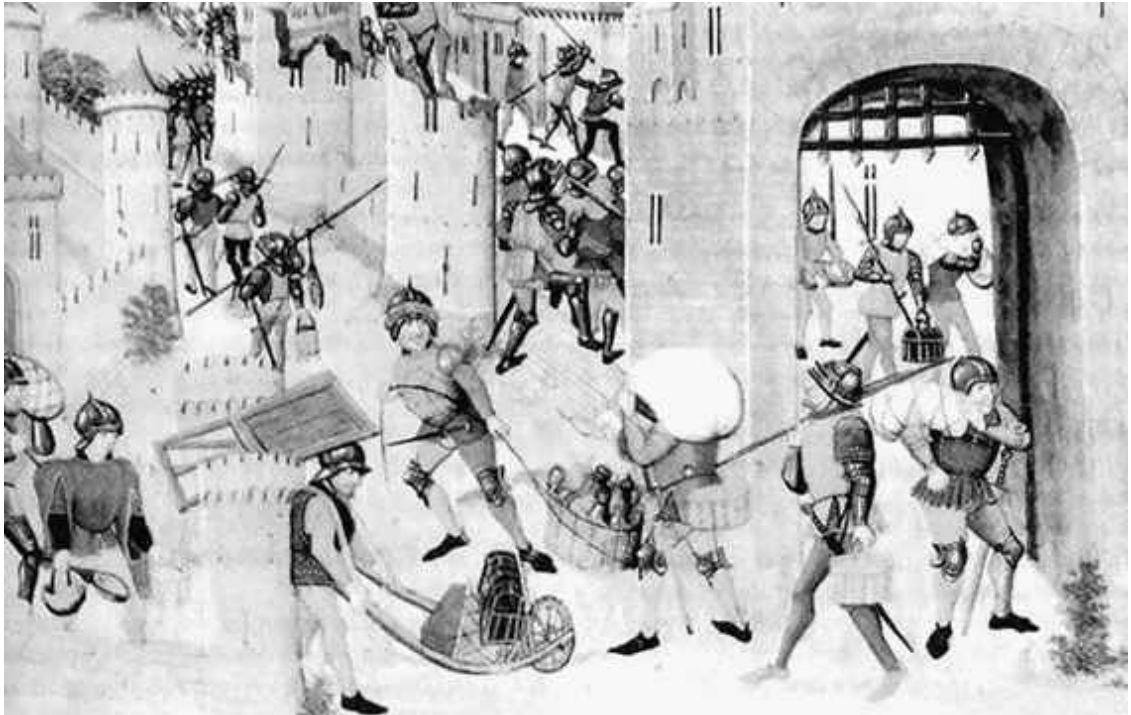
Захват города во время Столетней войны

Дальнейшему развитию, к сожалению, помешала Столетняя война, которая, хотя и не миновала Эльзаса, но все же в какой-то степени его пощадила. Развязанная англичанами, сначала она была всего лишь борьбой за право обладания французским наследством. Разрастаясь, ссора царственных родичей превратилась в конфликт межнациональный и, судя по названию, данному позднейшими историками, беспрецедентно длинный. В него было вовлечено все население двух держав, благодаря чему сложилось четкое представление о национальном государстве. Кроме того, именно тогда произошел переход от рыцарских баталлий, осуществлявшихся силами сюзеренов и вассалов, к войне государственной, которая велась профессиональными войсками. Большинство сражений Столетней войны проходило на севере Франции, поблизости от Эльзаса, но защищенный Вогезами край оказался вне военного пекла. Тем не менее прошедшие по его землям англичане, бургиньоны и арманьяки оставили после себя не только мрачные воспоминания, но и вполне материальные следы, донныне сохранившиеся на стенах замков.