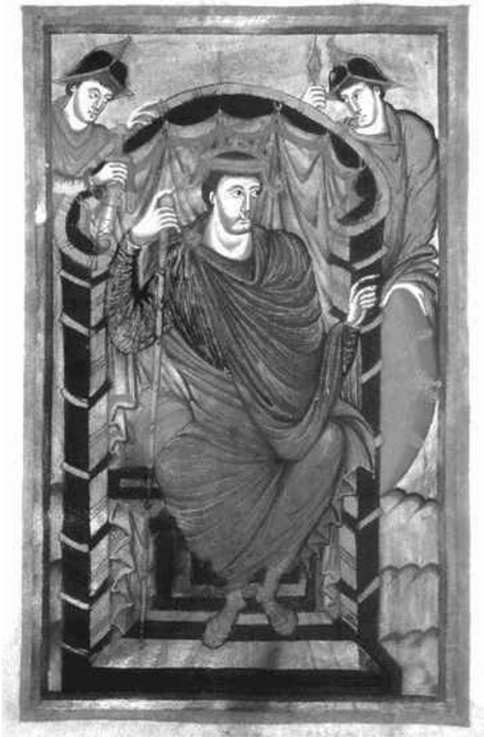
Лотарь, мятежный внук Карла Великого

Сменившие их Каролинги – королевская династия, основанная Карлом Великим – привнесли в Эльзас, тогда бывший частью Алемании, порядок, главным образом за счет военной силы и распространения христианства. При них были построены многие известные ныне монастыри; заботясь о том, чтобы виноградники обрабатывались регулярно, они заложили основу экономического благополучия края. Со смертью Карла Великого в 814 году раздела империи не произошло, поскольку из 20 детей императора прямым наследником оказался всего один, уже коронованный Людовик Благочестивый. Братоубийственную войну начали его сыновья