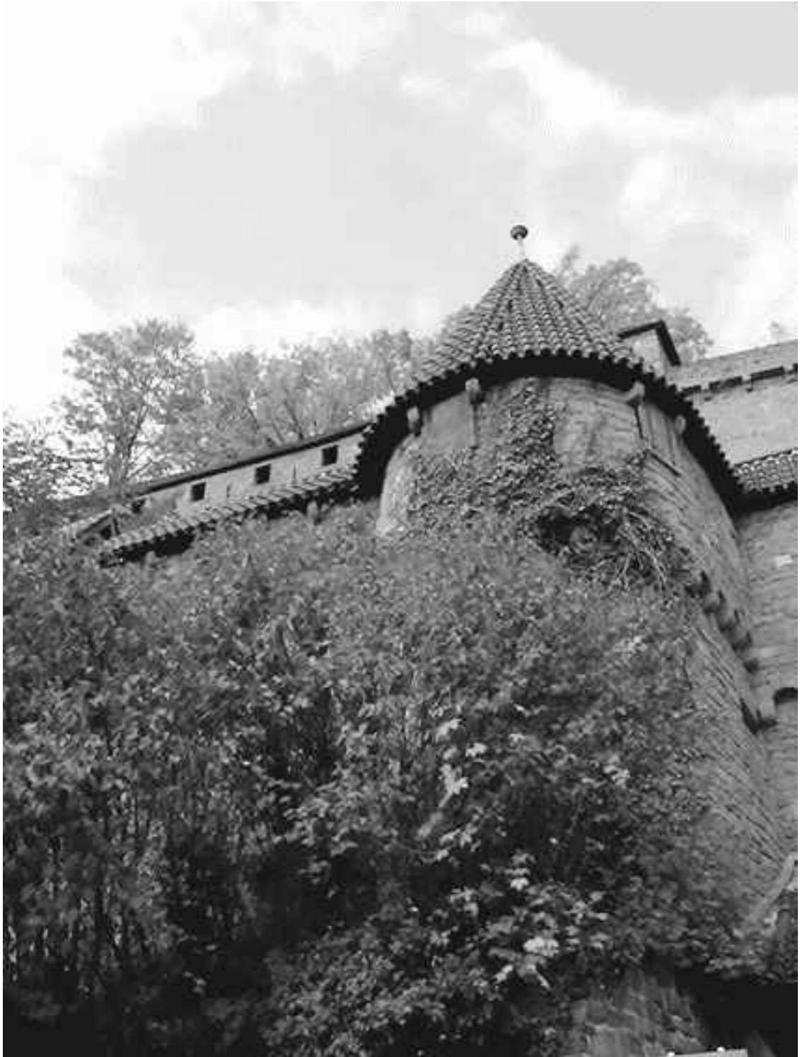
Высокий Кёнигсбург. Сторожевая башня со стрелковой галереей позади

Главный вход открывал путь к одной из башен, а она, в свою очередь, выходила на нижний, доступный для всех хозяйственный двор. Сюда выходили двери мастерских и комнат прислуги. Тут работали кузнец и мельник, странники могли отдохнуть на постоялом дворе, покормиться за хозяйский счет, послушать бродячих музыкантов. Здесь же находились конюшня, свинарник и прочие помещения для скота. Забота обо всем, что было необходимо для жизни, лежала на плечах самих обитателей замка. При осаде этот двор, в котором могли поместиться жители всей округи, служил убежищем. В мирное время он был открыт для заезжих торговцев