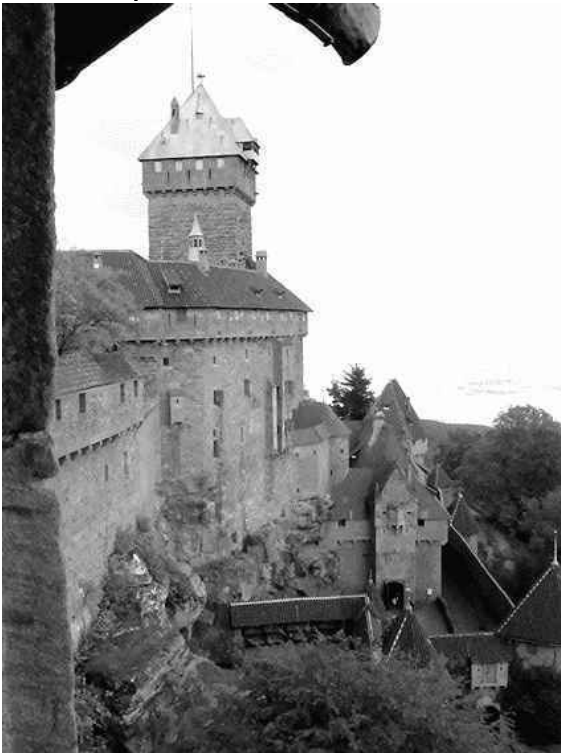
Высокий Кёнигсбург. Донжон крепости предназначался для обороны и временного жилья

Главная башня замка могла быть приспособлена и для постоянного жилья. Вначале такая постройка была единственной внутри стен и потому являлась домом, где жили все обитатели замка. С этажа на этаж вели деревянные лестницы или каменные ступени, устроенные в толще стены. Зал-столовая с огромным камином занимал целый этаж.