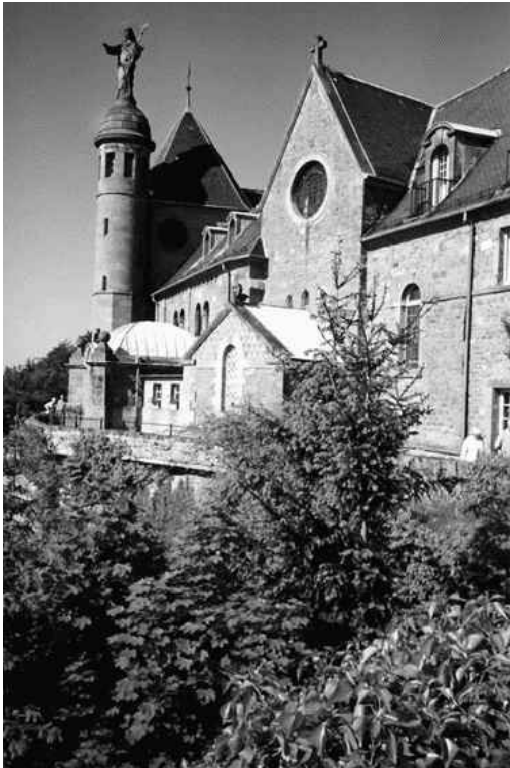
Монастырь Святой Одиллии. Обретя зрение, паломники могут полюбоваться великолепием романской архитектуры

Несмотря на раздробленность народов Галлии, кельтские чародеи действовали согласованно. Раз в год они собирались для обсуждения насущных проблем и могли, например, начать или остановить войну.