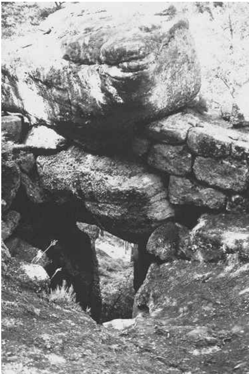
Холм Святой Одиллии. Сооружения язычников-кельтов десятки веков существуют вблизи христианского монастыря

Жители Эльзаса бережно хранят обычаи предков. Память о кельтах, например, увековечена вблизи холма Святой Одиллии, слепой дочери герцога Этиньона, в VII веке испытавшей чудо исцеления, впоследствии основавшей монастырь и ставшей покровительницей края. Названная в ее честь обитель теперь считается местом священным, ведь именно здесь, в живописном предгорье, несчастная герцогиня обрела зрение, умывшись водой из ключа. Святой источник до сих пор привлекает толпы паломников, которые питают надежду на избавление