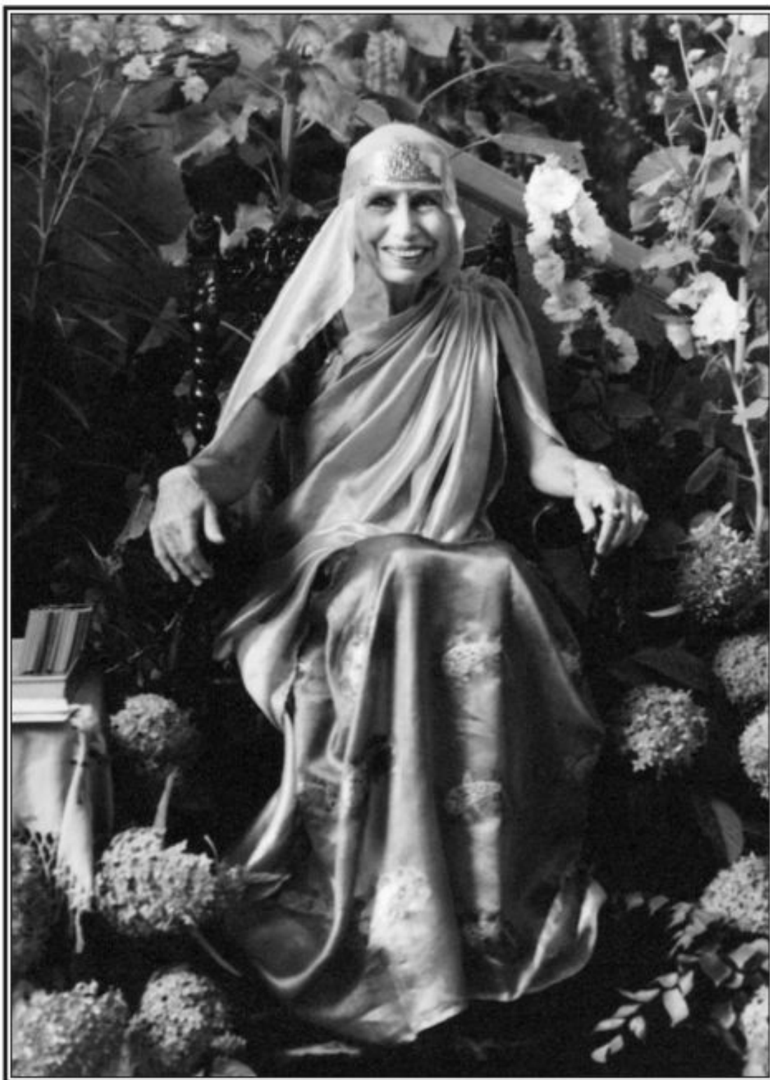
Мать – 1954 г.