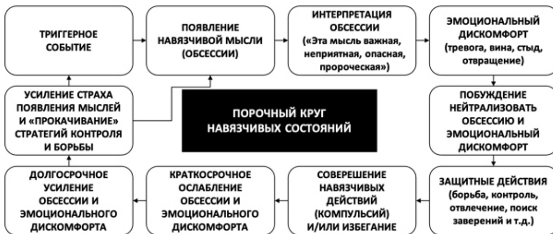
Рис. 1. Порочный круг навязчивых состояний

Человек с обсессивно-компульсивным расстройством может достаточно долгое время блуждать в порочном круге навязчивых состояний (рис. 1).