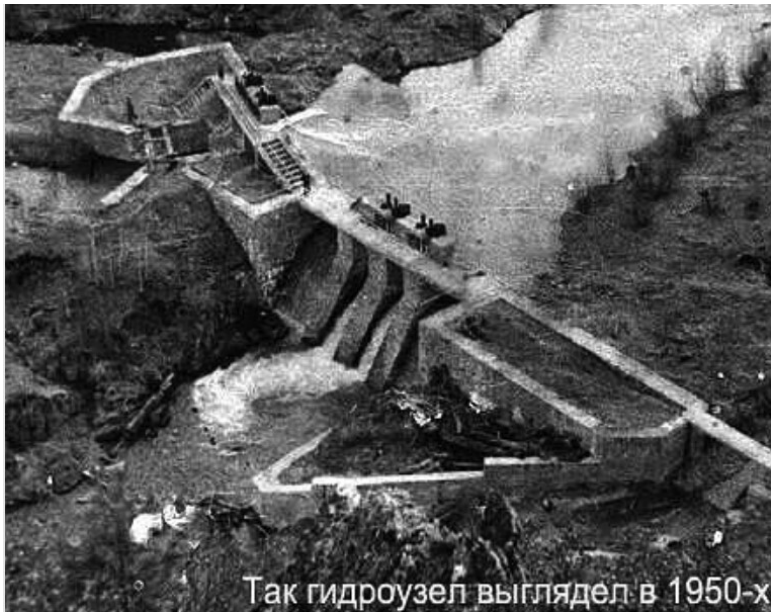
Так гидроузел выглядел в 1950-х

Ранняя весна, плотина работает «на сброс».