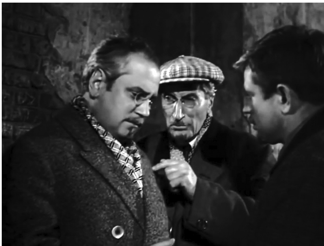
Кадр из телефильма «Операция «Трест»