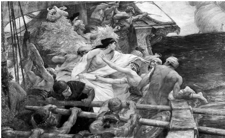
Герберт Дрейпер. Золотое руно. 1904

Ученые придерживаются различных точек зрения в вопросе о времени, когда это могло происходить, но принято считать, что поход греческих героев за Золотым руном произошел до начала Троянской войны. Это, конечно, миф, на основании которого вряд ли возможно говорить о существовании богатой страны колхов, которая якобы произвела огромное впечатление на древних греков.