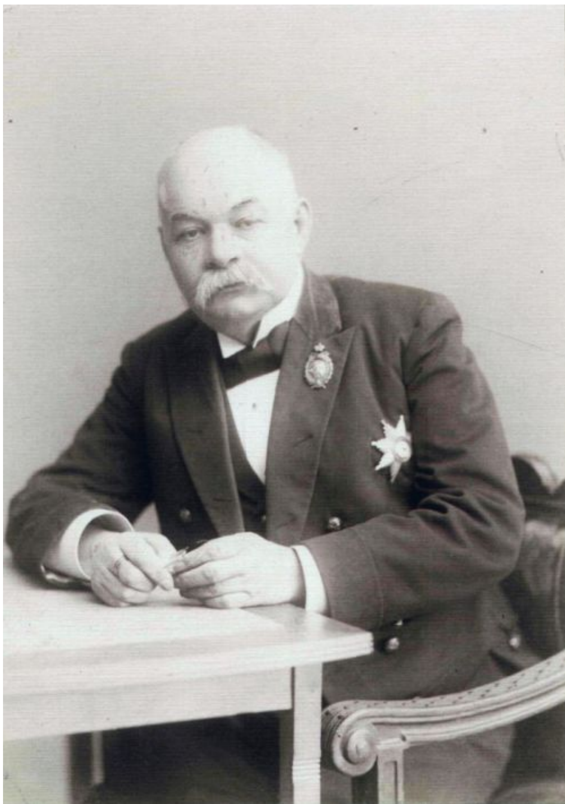
Илл.2. Иван Цветаев

В 1893 году профессор Цветаев решил превратить скромную университетскую коллекцию в музей, достойный первопрестольной столицы. Правда, его первый замысел выглядел относительно скромно – собрание античного искусства. Но и это требовало затрат не только на строительство нового здания, но и на покупку множества макетов, копий, реликвий, рисунков. Впрочем, очень скоро стало ясно, что экспозицию нужно дополнить египетским, ассирийским