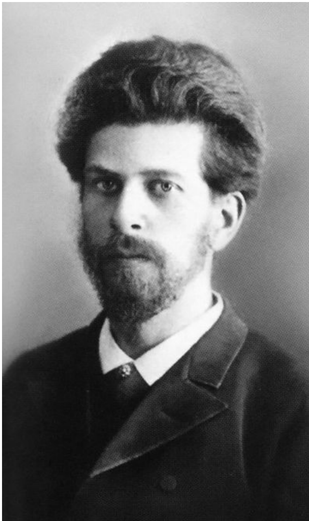
Илл.4: Зодчий Роман Клейн