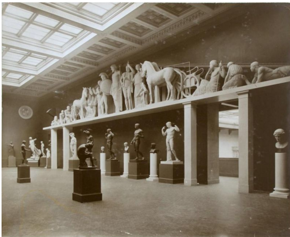
Илл.3. Греческий зал

Электричество в экспозиционные залы не проводили. Считалось, что осматривать музей следует при естественном освещении, и открыт он будет только в светлое время суток. Клейновскому дворцу искусств требовалась сложная система освещения. Инженер Владимир Шухов создал проект внутренних коммуникаций музея – уникальных трехуровневых стеклянных перекрытий, через которые в огромный дом с колоннами проникало солнце. А над парадной лестницей работал Иван Жолтовский – в то время еще молодой архитектор, а в будущем – настоящий мэтр московского зодчества.