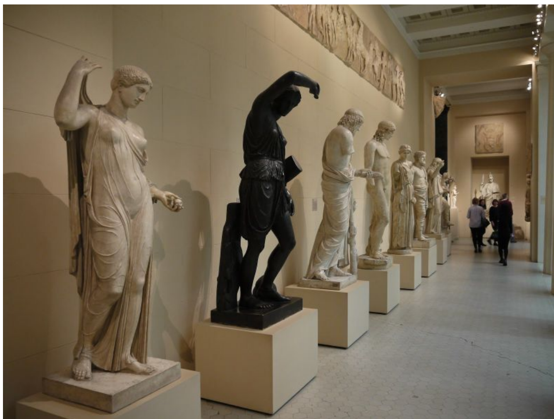
Илл.5. Легендарные копии античных статуй

Он ушёл из жизни через полтора года после открытия музея – осенью 1913 года, в 66 лет. Исполнилась мечта Цветаева – и оказалось, что профессор отдал все силы своей мечте. Незадолго до смерти он сказал одному из своих учеников: «Я сделал всё, что мог». Основоположника в музее никогда не забывали. Его просто невозможно забыть. И дело не в мемориальной доске, на которую трудно не обратить внимание при входе в музей. Там жив его дух.