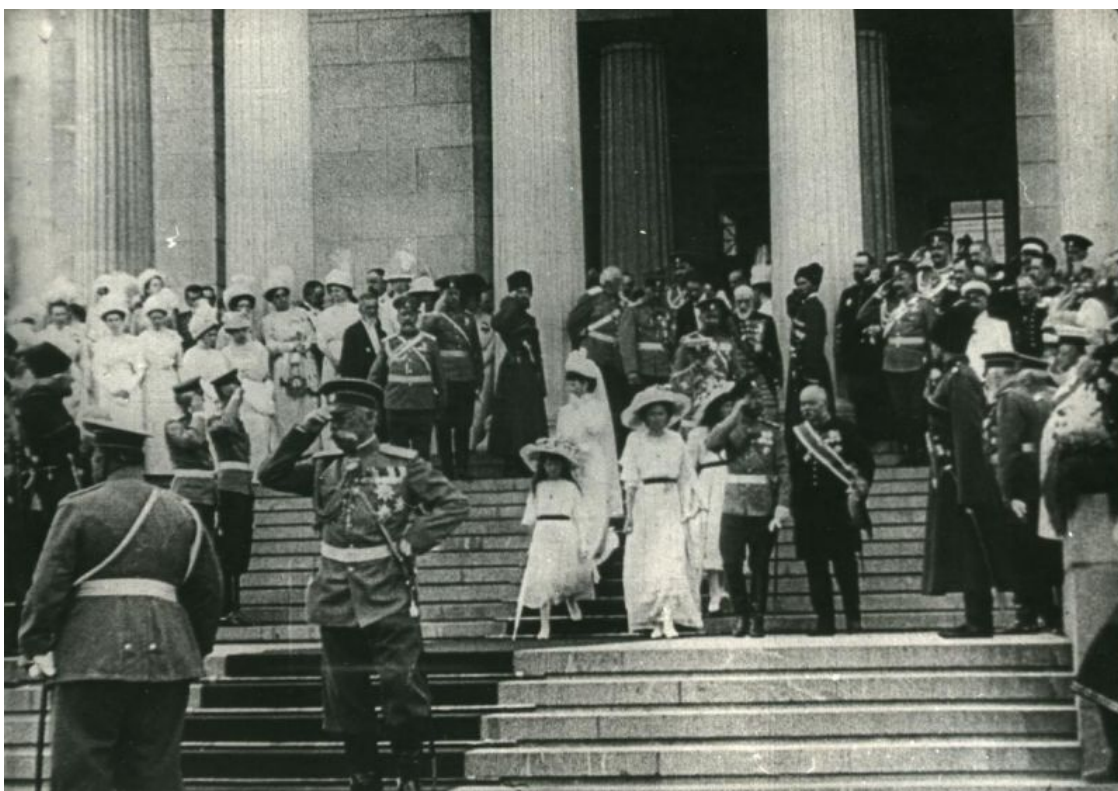
Илл.1. Открытие Музея изящных искусств

Больше 110 лет назад, 13 июня 1912 года, в Москве звучали приветственные речи и гремели оркестры. И не потому, что начиналось лето и цвела сирень. В новом доме с античными колоннами и стеклянной крышей открылся Музей изящных искусств имени императора Александра III, ныне – музей Изобразительных искусств имени А. С. Пушкина. В Москве появилось пространство культуры, которое можно с наслаждением разгадывать годами. Не любить Пушкинский музей невозможно – это целый мир, великолепный заповедник мирового искусства на старинной московской улочке. Самое время вспомнить, с чего всё начиналось.