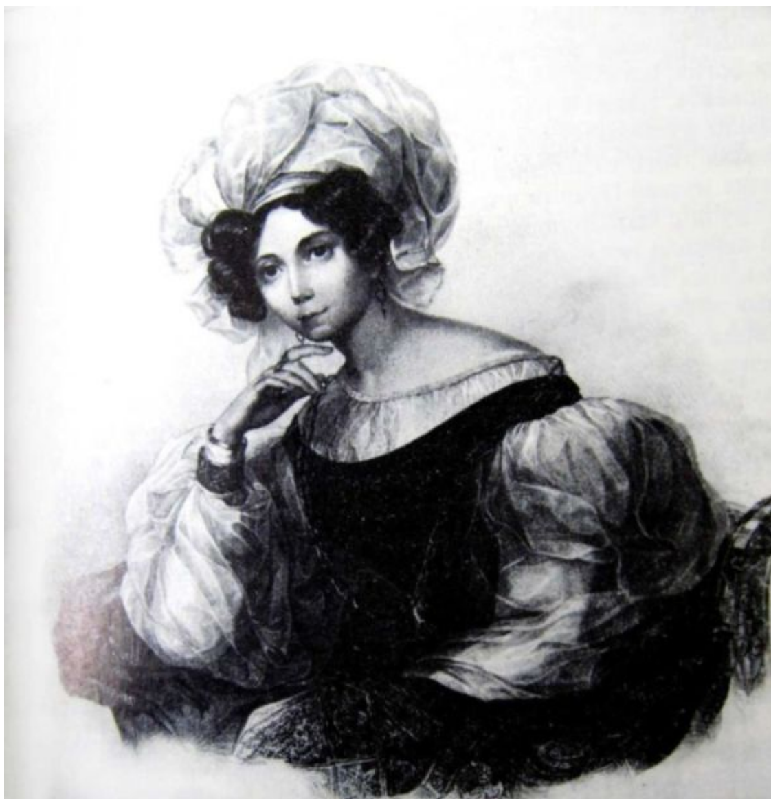
Илл.7. Зинаида Волконская

Мы, Русские, с удовольствием замечаем, что Изыщныя Искусства, благодаря попечениям Правительства, глубоко вкоренились у нас и принесли плоды, дающие нам право и в сей отрасли просвещения войти в достойное состязание с другими народами. Художники Русские со славою вознаграждают пожертвования и оправдывают ожидания Монарха и Отечества. Но желательно бы было, чтоб Изыщныя Искусства не ограничивались одними мастерскими художников, но вошли бы непосредственно в круг общественного воспитания и образовали бы в народе чувство эстетическое. Сей цели невозможно достигнуть, не имея перед очами лучших произведений резца, кисти и циркуля.