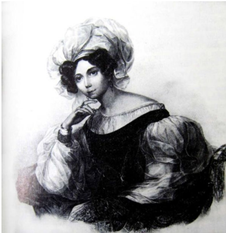
Илл.7. Зинаида Волконская

Петербург богат сими способами: в Эрмитаже, Академии Художеств, во многих частных галлерейх, между сокровищами оригинальными, изящные слепки и копии могут дать понятие об искусстве всякому, желающему прони-