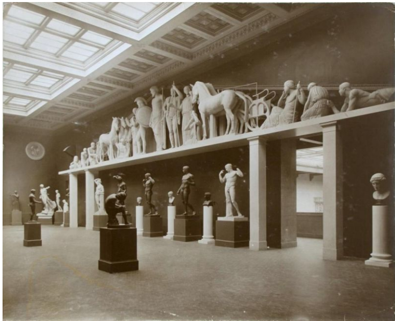
Илл.3. Греческий зал

Электричество в экспозиционные залы не проводили. Считалось, что осматривать музей следует при естественном освещении, и открыт он будет только в светлое время суток. Клейновскому дворцу искусств требовалась сложная система освещения. Инженер Владимир Шухов создал проект внутренних коммуникаций музея – уникальных трехуровневых стеклянных перекрытий, через которые в огромный дом с колоннами проникало солнце. А над парадной лестницей