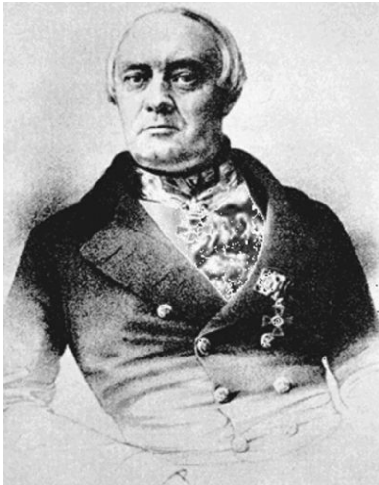
Илл.8. Степан Шевырëв