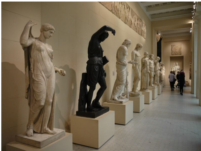
Илл.5. Легендарные копии античных статуй

Он ушёл из жизни через полтора года после открытия музея – осенью 1913 года, в 66 лет. Исполнилась мечта Цветаева – и оказалось, что профессор отдал все силы своей мечте. Незадолго до смерти он сказал одному из своих учеников: «Я сделал всё, что мог». Основоположника в музее никогда не забывали. Его просто невозможно забыть. И дело не в мемориальной доске, на которую трудно не обратить внимание при входе в музей. Там жив его дух.