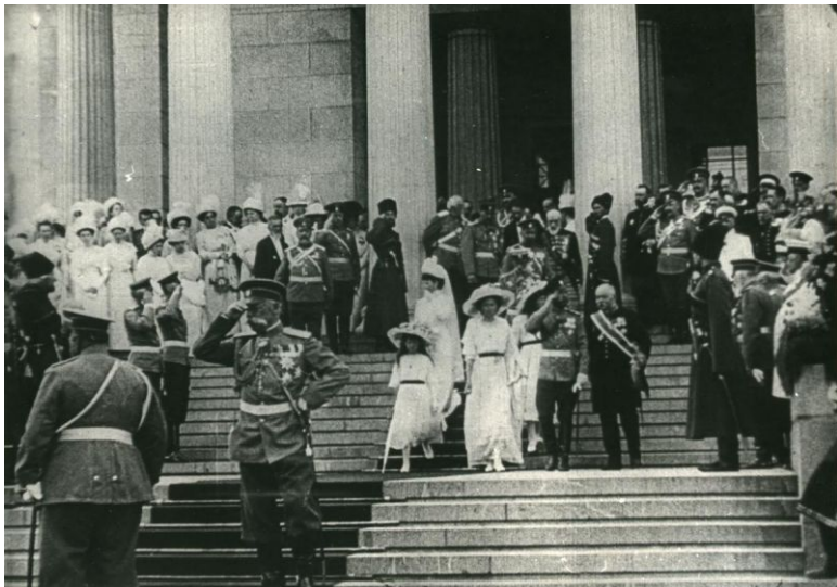
Илл.1. Открытие Музея изящных искусств