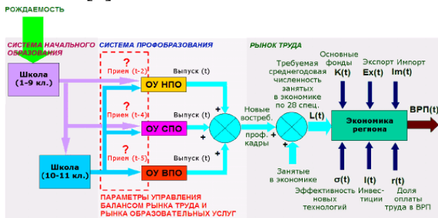
Рисунок 1. Структурная модель динамической системы «экономика – рынок труда – профессиональное образование» [7]

Прогнозирование спроса и предложения на рынке труда Вологодской области