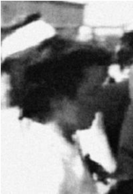
«Гильда фон Зееф» – фрагмент кинокадра, снятого в Москве