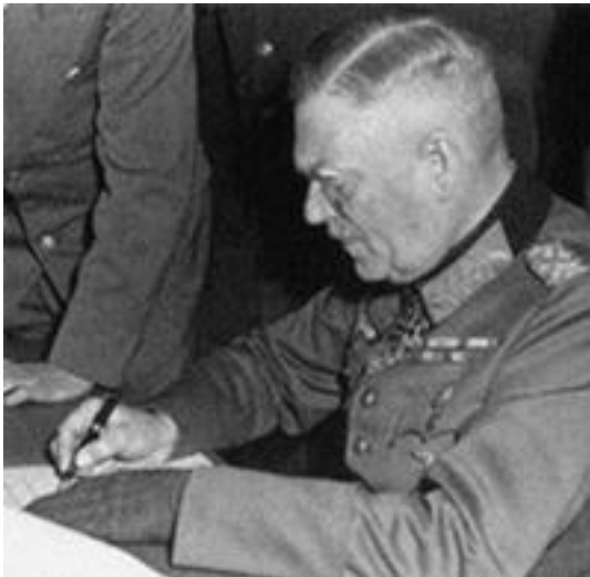
В. Кейтель, 8 мая 1945 г.