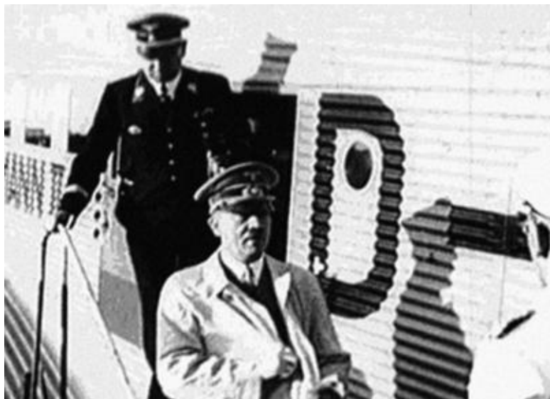
24 августа 1939 г. Гитлер прилетел из Берхтесгадена в

ла из Москвы, в воздухе якобы была получена команда фюрера приземлиться не в Берхтесгадене, а в Берлине. «Неожиданно наш самолет радиogramмой повернули на Берлин, куда Гитлер вылетел в тот же день», – написал в своих предсмертных мемуарах Риббентроп. Это значит, что Гитлер приземлился в Берлине, якобы возвращаясь из Берхтесгадена, в тот самый день, когда Риббентроп прилетел из Москвы. Интересно отметить, что и Гитлер, и Риббентроп были в этот день (24 августа) в белых плащах (см. ниже), хотя Риббентроп прилетел в Москву 23 августа в черном (см. справа).