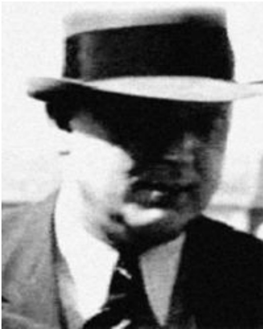
Охранник возле Евы Браун – «Виппер» – «Раттенхубер»

Но под фотографией в Интернете была подпись: «Ганс Раттенхубер... группенфюрер СС и генерал-лейтенант полиции (24.2.1945), начальник личной охраны Гитлера». Мало того, что таким образом обнаружен двенадцатый человек из самого близкого окружения фюрера, побывавший в августе 1939-го в Москве, но к тому же он начальник его личной охраны, а еще и его бессменный телохранитель, который