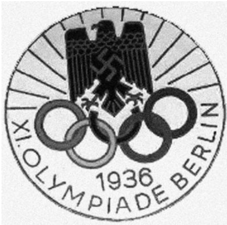
Эмблема берлинской Олимпиады 1936 г.