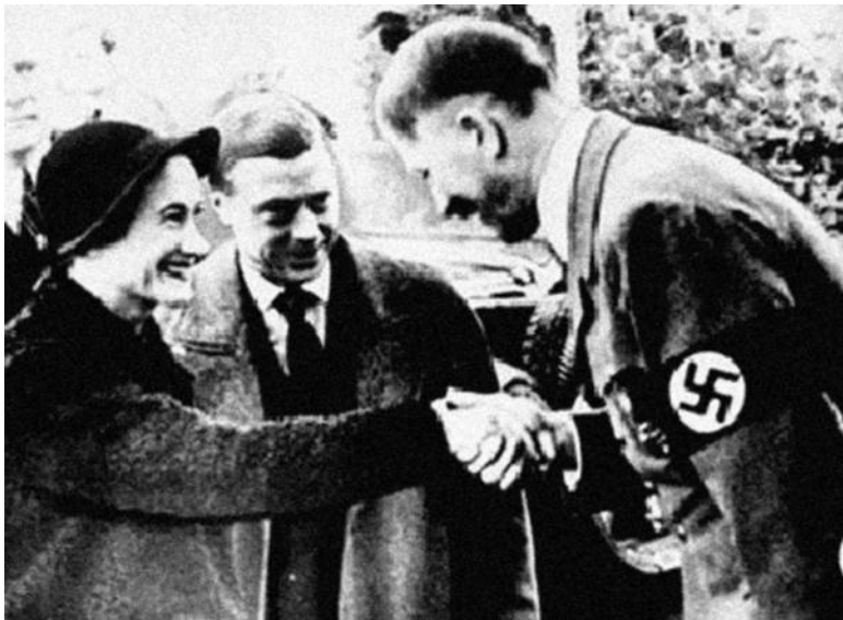
Герцог и герцогиня Виндзорские на приеме у Гитлера в Бергхофе

Возможно, поводом для этого послужила известная в те годы неприязнь Эдуарда к Черчиллю. В любом случае приведенные выше факты близкого общения Гитлера с представителями англосаксонского истеблишмента показывают, что мое предположение об англосаксонской «версальской мине», заложенной с целью привести Германию к войне против СССР и в итоге приведшей ко Второй мировой войне, не лишено оснований. Эта цепочка «неофициальных» общений с Гитлером, преимущественно английских, ясно показывает: