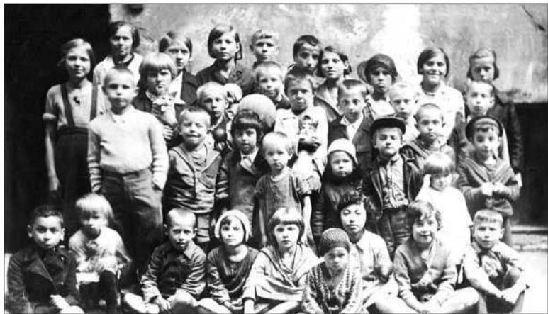
Дети предвоенного ленинградского двора. Публикуется впервые

Жили в окрестностях парка имени 1 Мая по-разному. В одиночку, «бригадами», семьями. В основном большими.