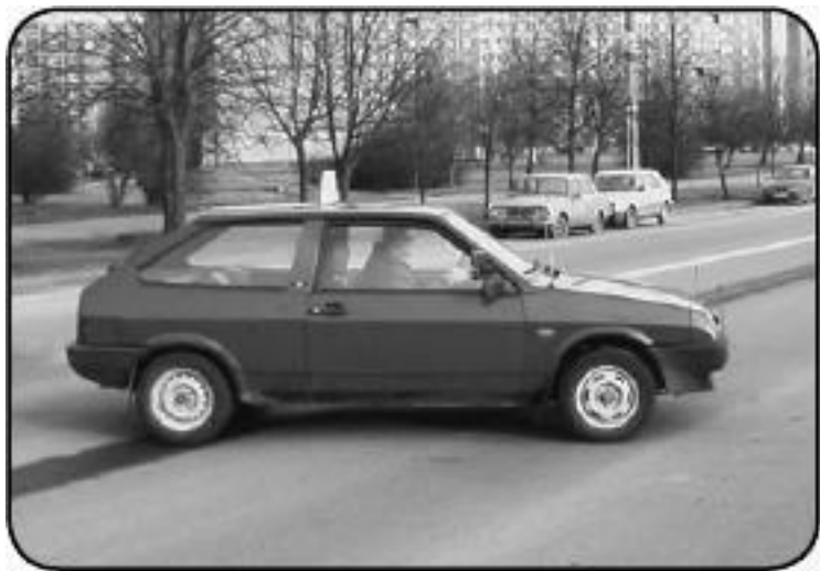
Рис. 1.1. ВАЗ-2108 – первый советский переднеприводной автомобиль

В отечественном автомобилестроении первой полноприводной машиной стала «Нива». Отключение одной из ведущих пар колес у нее конструктивно не предусматривалось. Но русские умельцы быстро научились решать эту проблему простым и эффективным способом: демонтировался «лишний» карданный вал. После этого на соответствующий мост крутящий момент не передавался, и он не функционировал.