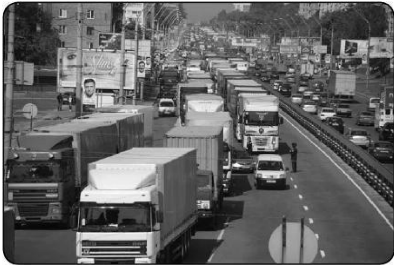
Рис. 1.3. Автомобильная пробка

Многие будущие автомобилисты совершенно напрасно полагают, что наличие собственного автомобиля и умение им управлять автоматически решит все имеющиеся проблемы и принесет в жизнь исключительно комфорт и удобство. Вам придется столкнуться с целым рядом проблем, до сих пор неизвестных, и будет лучше, если подготовиться к ним заранее.