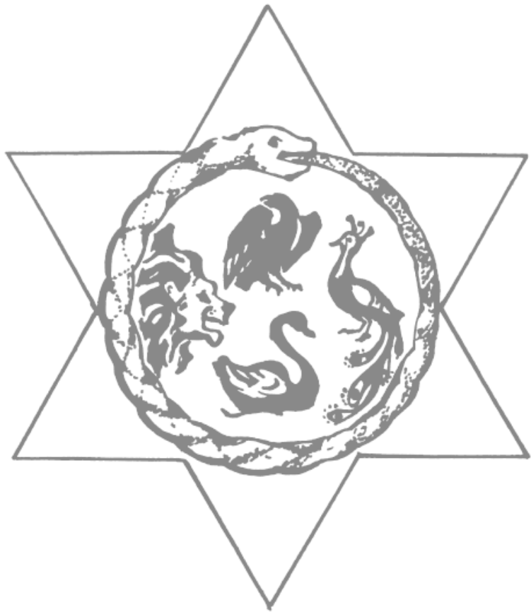
Рисунок 4. Гексаграмма с четырьмя зверями

Свое начало символ берет в древних цивилизациях (пред-