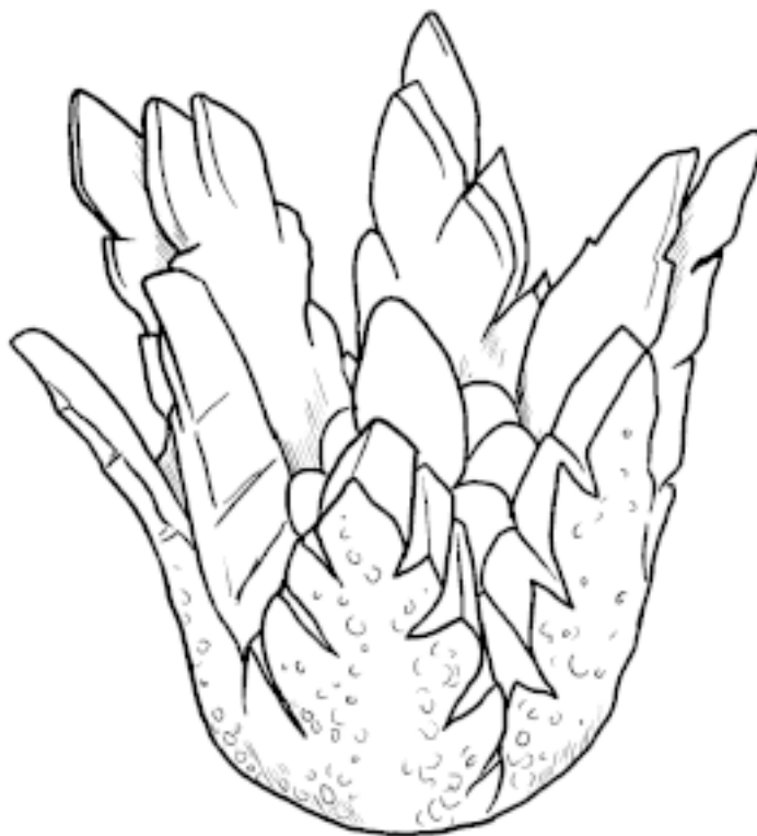
Лилия: этапы изготовления и готовое изделие

5. Аналогичным образом вырезать лилию из второй половинки огурца.