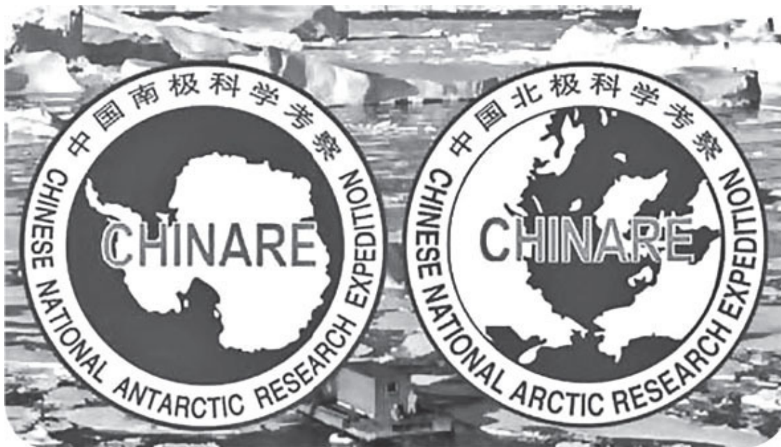
Эмблема китайских полярных экспедиций.

Полярный НИИ Китая (ПНИИ) основан в 1989 году и располагается в Шанхае. В составе ПНИИ функционирует всекитайский полярный информационный центр, созданный в 1995-м. В его функции входят сбор и систематизация данных, архивное хранение всей информации по полярным исследованиям и ее размещение в глобальной и локальных сетях. Также на центр возложены обязанности по популяризации полярных исследований в обществе (библиотека полярной литературы, музей полярных исследований, полярный журнал и т. п.).