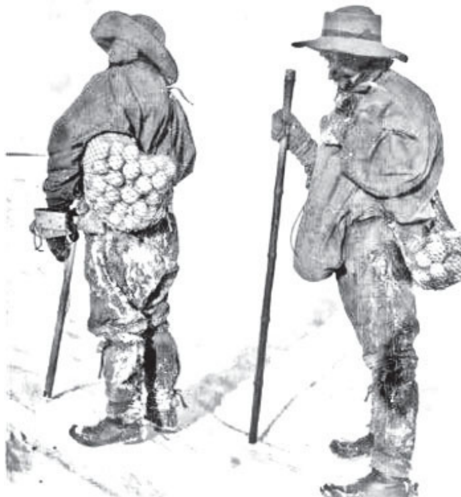
Экспедиция Р. Скотта готовится к Пасхе, в сетках яйца пингвинов, Антарктида, 1901 г.

Вот что писал Роберт Скотт о долине Земли Виктория: «Мы не видели никаких живых существ, даже мха или лишайника... Это конечно «Долина Мертвых» из библейских пророчеств, даже самый большой ледник, который когда-то продавил их своим весом, умер далеко отсюда».