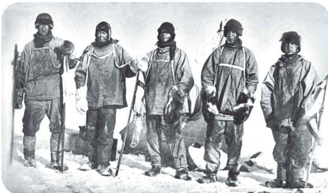
Экспедиция Роберта Скотта.

В 1901 году англичанин Роберт Скотт (1868–1912) на судне «Дискавери» отправился к шестому континенту и в январе 1902 года впервые сошел на берег открытого им полуострова Антарктиды, получившего имя короля Эдуарда VII. Первая попытка Р. Скотта достичь Южного полюса не удалась. Судно оказалось в ледяном плену, поэтому экспедиции пришлось провести в Антарктиде две зимы. Все это время англичане занимались изучением материка, исследовали шельфовый ледник Росса, внутреннюю часть Земли Виктории. В итоге экспедиция привезла в Англию 12 томов с метеорологическими, гидрологическими, биологическими, магнитными наблюдениями.