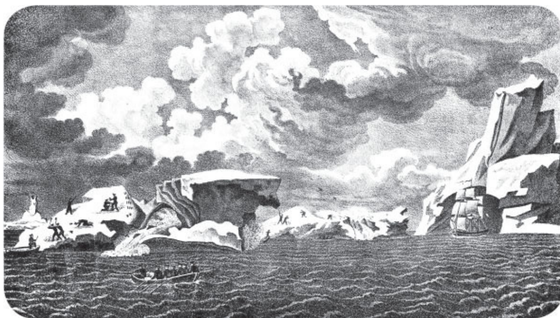
Павел Михайлов. Вид ледяных островов. Иллюстрация из атласа Беллинсгаузена. Санкт-Петербург, 1831 год.

В финале описания своего путешествия Ф. Ф. Беллинсгаузен писал: «...обретено двадцать девять островов, в том числе в южном холодном поясе два, в южном умеренном – восемь, а девятнадцать – в жарком поясе; обретена одна коралловая мель с лагуной». Описание экспедиции было опубликовано в 1831 году на русском языке в 2-х томах с приложением великолепного и подробного атласа рисунков; в 1842 году был опубликован краткий отчет о ней в Германии.