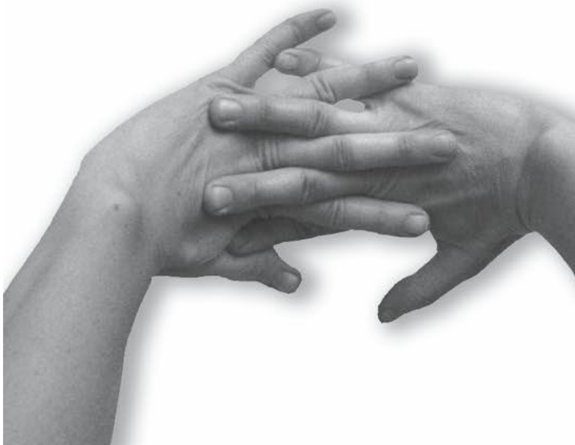
Фото 1, д