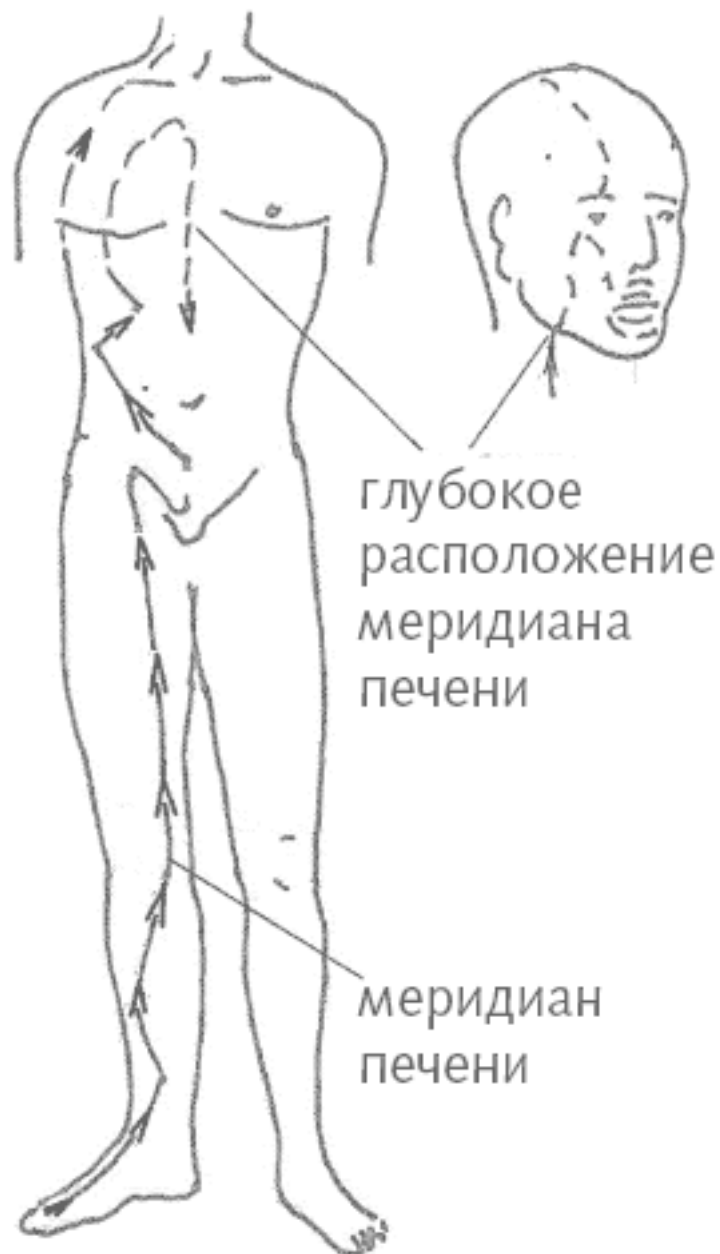
Рис. 2. Большой меридиан печени

Ладони и стопы – полноценные проекции, на них проходят собственные мини-меридианы и существуют собственные мини-области накопления. В Индии их назвали бы «чакры», в Китае – области «дань-тянь». Молодая система су-джок использует опыт всей восточной и европейской медицины, поэтому часто пользуется комбинированными обозначениями. Меридианы рук и стоп называют бель-меридианы (специальные, особые, уменьшенные меридианы), а области накопления энергии – бель-чакры .