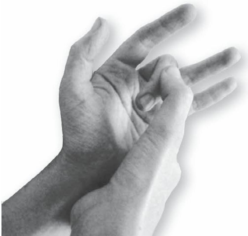
Фото 1, б

5. Похрустим разогревшимися пальцами. Сгибаем по очереди каждый сустав 4 пальцев (от указательного до мизинца, фото 1, б). Если суставы хорошо разработаны, никакого хруста и щелчка мы не почувствуем – и это очень хорошо! Но приятное тепло и расслабление от ладоней до мышц предплечья вы почувствуете в любом случае. Те же движения повторяем для другой руки.