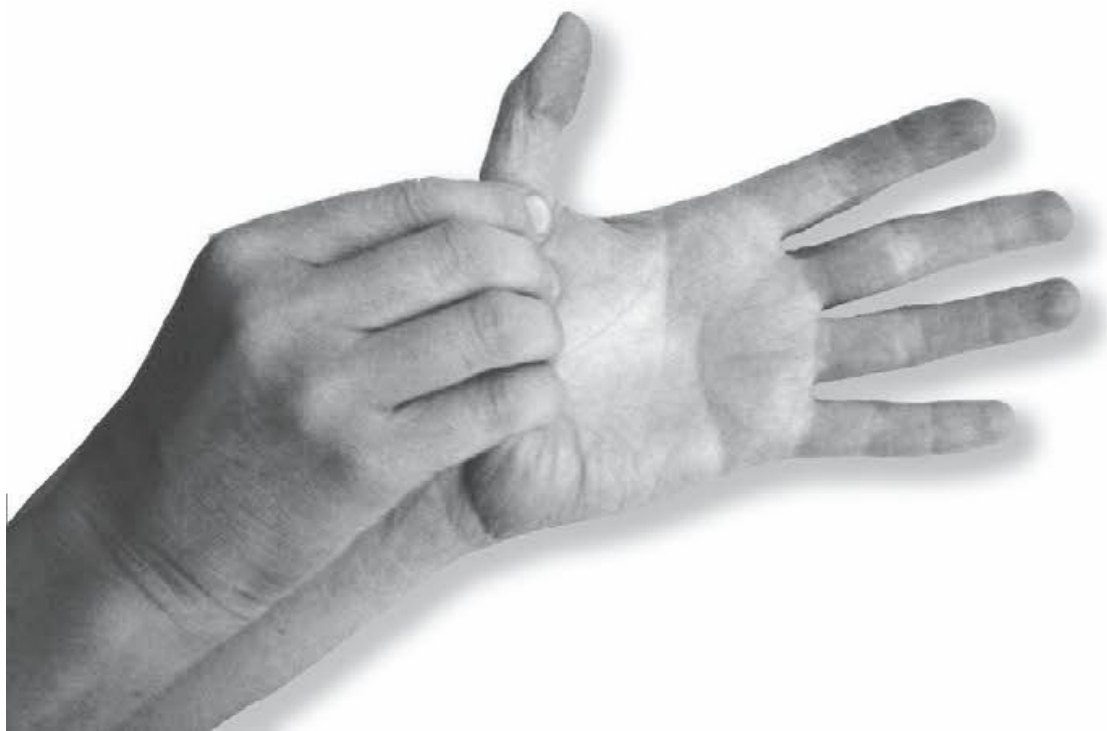
Фото 1, а

4. Растираем и разминаем возвышение большого пальца, переходя на ребро ладони (фото 1, а). Затем массируем пальцы, начиная с большого, покручивающим движением – представьте себе тугую перчатку, которую снимаем с каждого пальца по отдельности. Задействуем для «снятия» 2–3 пальца массирующей руки. Повторим все движения для другой руки.