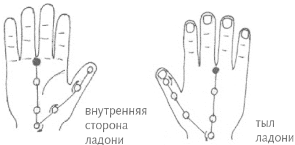
Рис. 3, б, в. Бель-чакры ладони

Воздействие на короткие и легкодоступные меридианы ладони по закону подобия исправляет внутренние неполадки в организме в той же степени, что и работа с большими меридианами. Так из зоны ладони запускается саморегуляция организма. И те, кто уже привык к су-джок, не дожидаются недомоганий, а просто регулярно растирают линии на руках в любую свободную минуту дома и на работе.