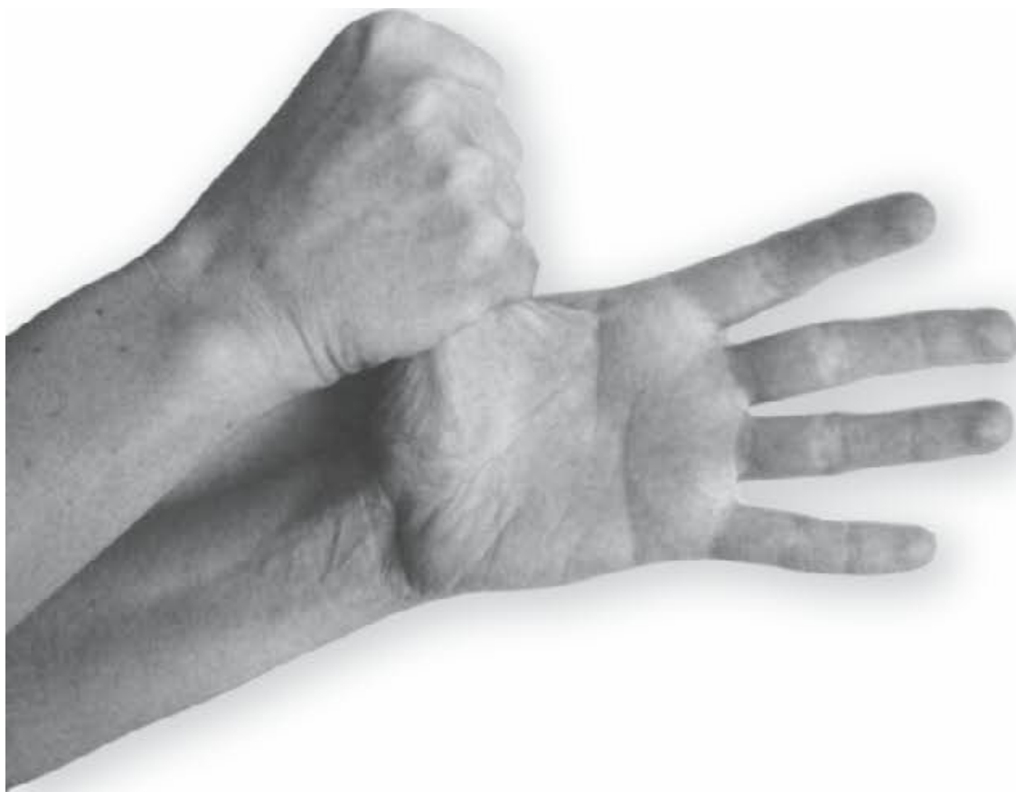
Фото 1, в