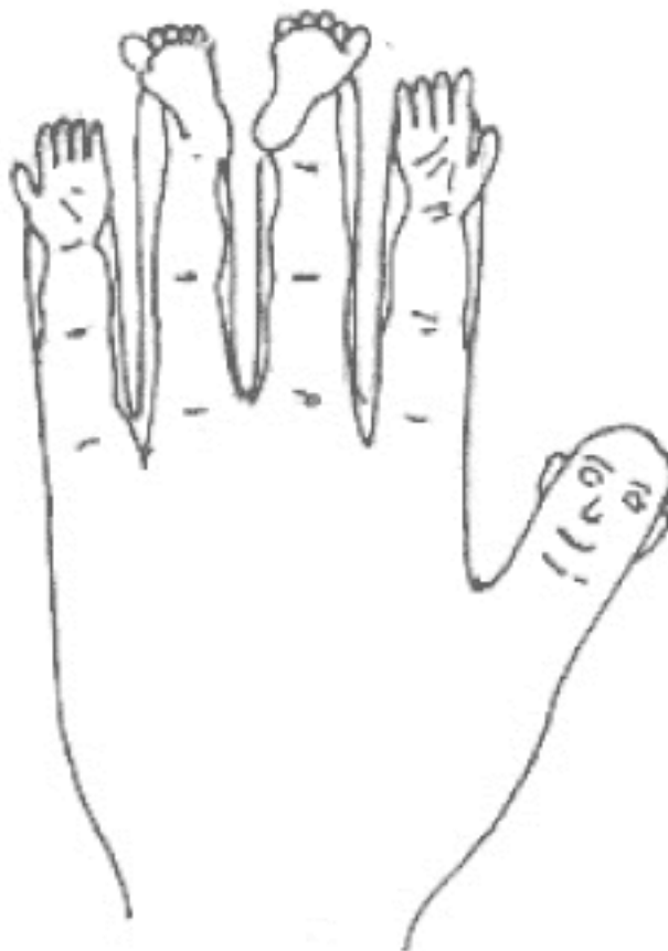
Рис. 1, а. Закон подобия на руке

Все восточные врачи в совершенстве умеют дистанционно управлять энергетическим обеспечением органов и систем. Мы перенимаем у них эту практику и уже многого добились! Но только доктор Пак Чже Ву совместил управление энергией с законом подобия, проявляющимся в нашем телосложении. Доктор отметил, что строение кистей рук и стоп похоже по сложению на скелет человека.