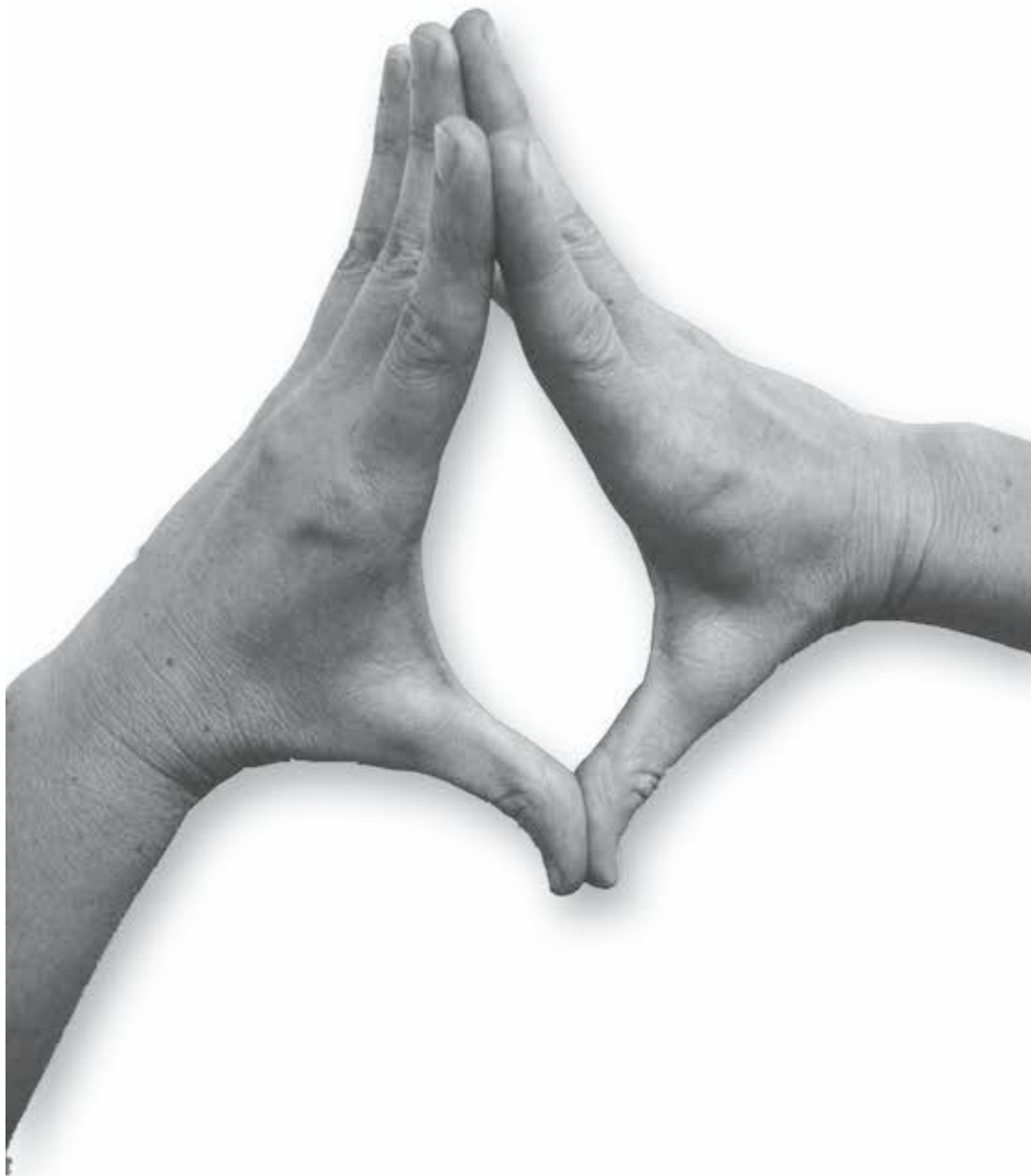
Фото 1, е

7. Пальцами массирующей руки надавливаем на середину ладони, чтобы суставы прогнулись в тыльную сторону (фото 1, г). Поочередно выполним движения для каждой руки.