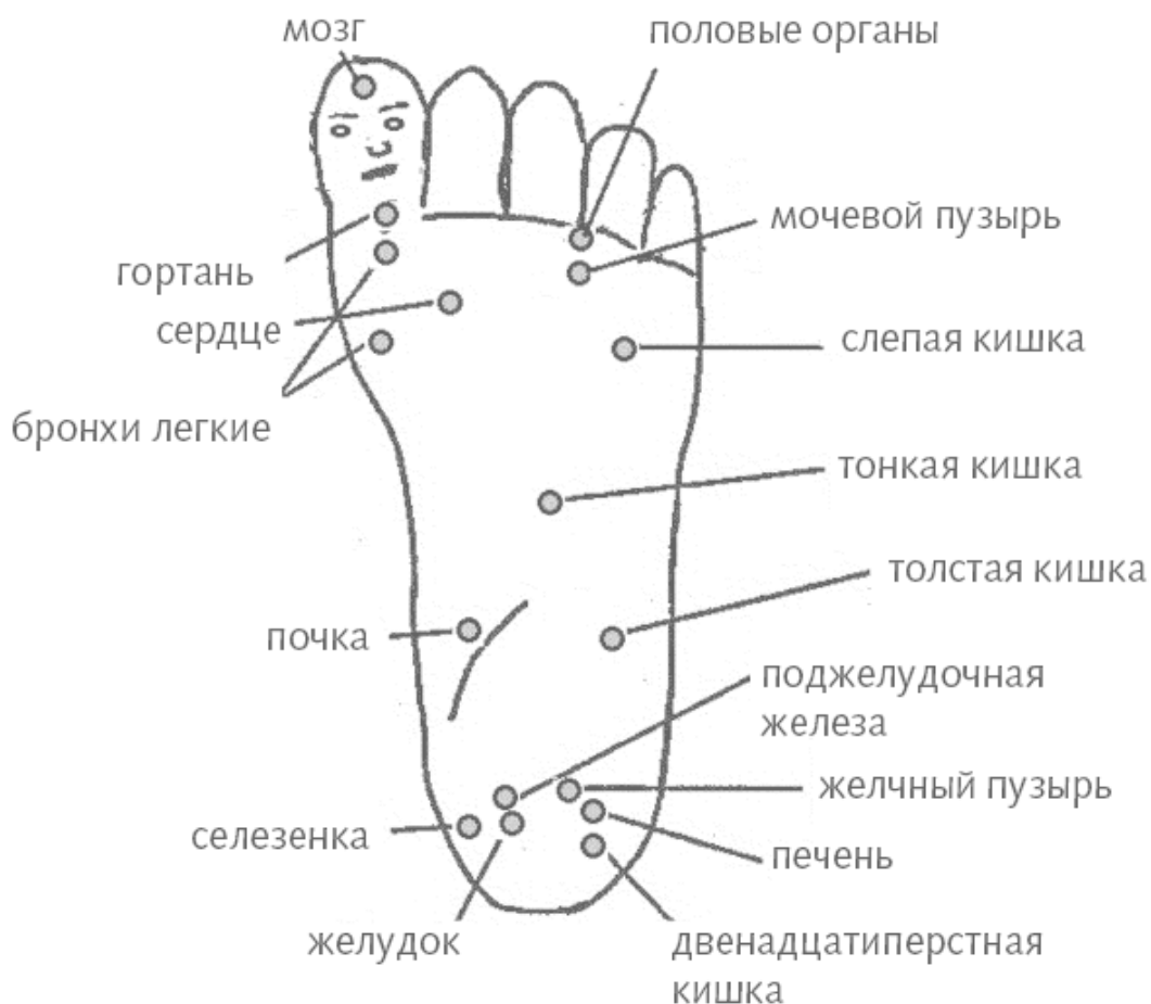
Рис. 4, б. Зонирование стопы

Своевременно определить болезненную зону на руке означает вовремя послать к связанному с ней органу сигнал исправления. Не только снять симптомы, но гармонизировать весь меридиан энергетической связи. В идеальном случае, исправив энергетический сбой, можно даже успеть предотвратить проявление болезни на физическом уровне!