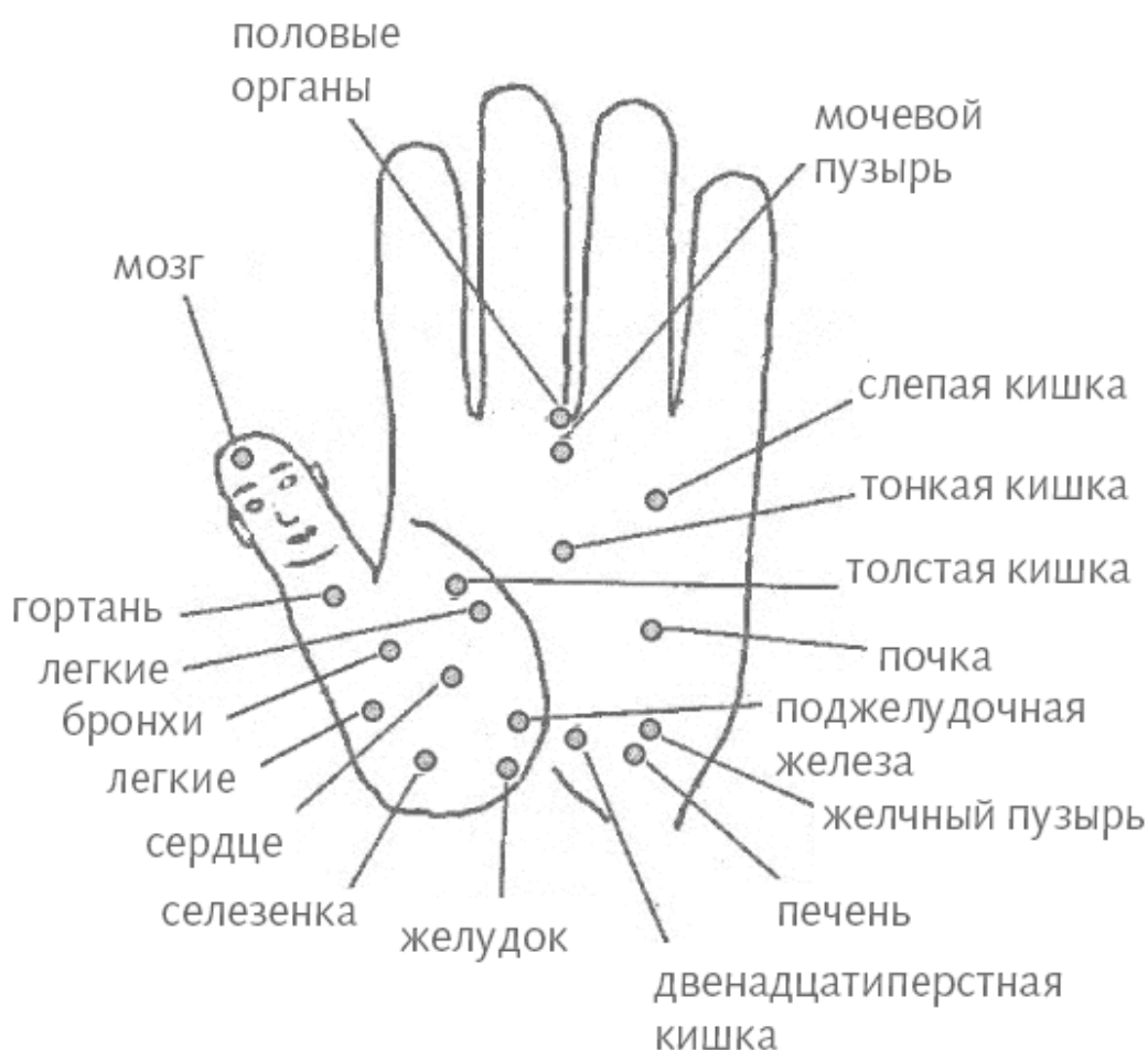
Рис. 4, а. Зонирование ладони

Обратите внимание на Атласы главных точек внутренних органов на ладони и на стопе (рис. 4, а, б). Каждый орган имеет выход на стопу и ладонь в определенных областях и реагирует на прикосновение к ним. Если органы болеют, в основных точках подобия и прилежащих областях возникает напряжение, чувствительность, может измениться температура прилежащей области, могут уплотниться мышцы ладони или стопы, кожный покров зоны подобия может локально изменить цвет. Индивидуальные реакции организма разнообразны, в зависимости от этого характер отражения болезни в точках соответствия тоже имеет индивидуальные черты.