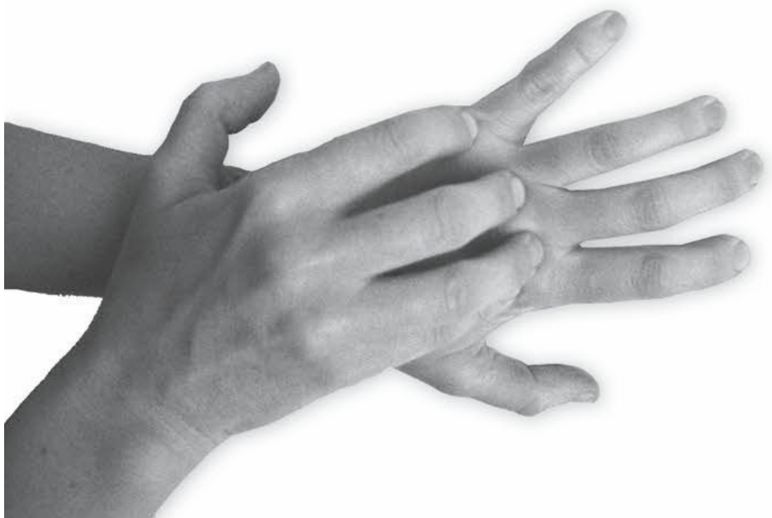
Фото 1, г