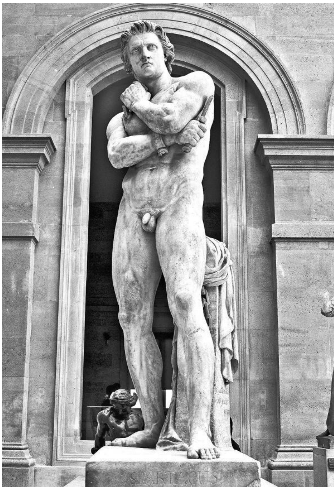
Скульптура Спартака работы Дени Фойятье. 1830.

Восстание Спартака (лат. Bellum Spartacium ) (74–71 гг. до н. э) – величайшее в древности и третье по счету (после первого и второго Сицилийских восстаний) восстание рабов. «Спартакская война» представляла прямую угрозу центральной Италии. Окончательно подавлено, в основном, благодаря военным усилиям Марка Лициния Красса, одного из соперников моло-