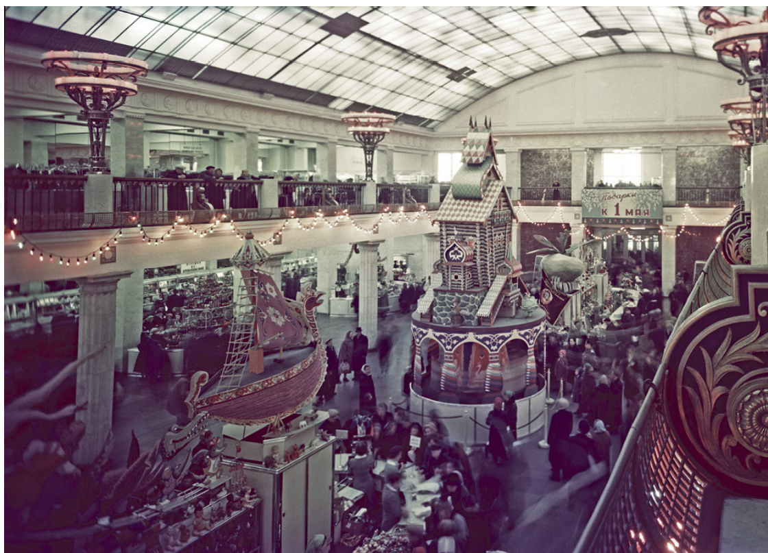
В универмаге «Детский мир». 1950-е гг.