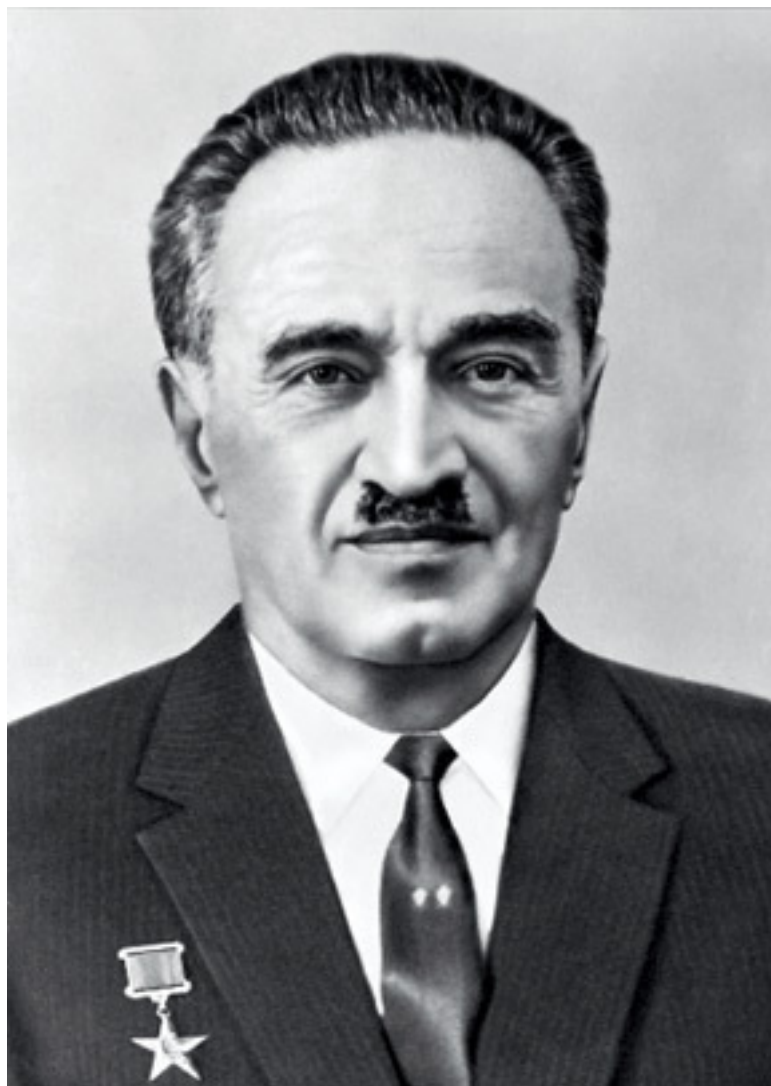
Анастас Иванович Микоян, член Президиума ЦК КПСС. 1965 г.

Анастас Иванович любил большие нарядные магазины. Однажды в командировке он увидел нью-йоркский Macy's, все девять его великолепных этажей, выстроенных в стиле манхэттенского ар-деко. Технические новинки, которыми щеголял магазин, – крутящиеся кронштейны для демонстрации платьев, электрические машинки для чистки обуви и взбивания коктейлей, эскалаторы, еще с деревянными ступенями, – произвели на партработника впечатление. И он решил, что такие же магазины нужны и советским людям.