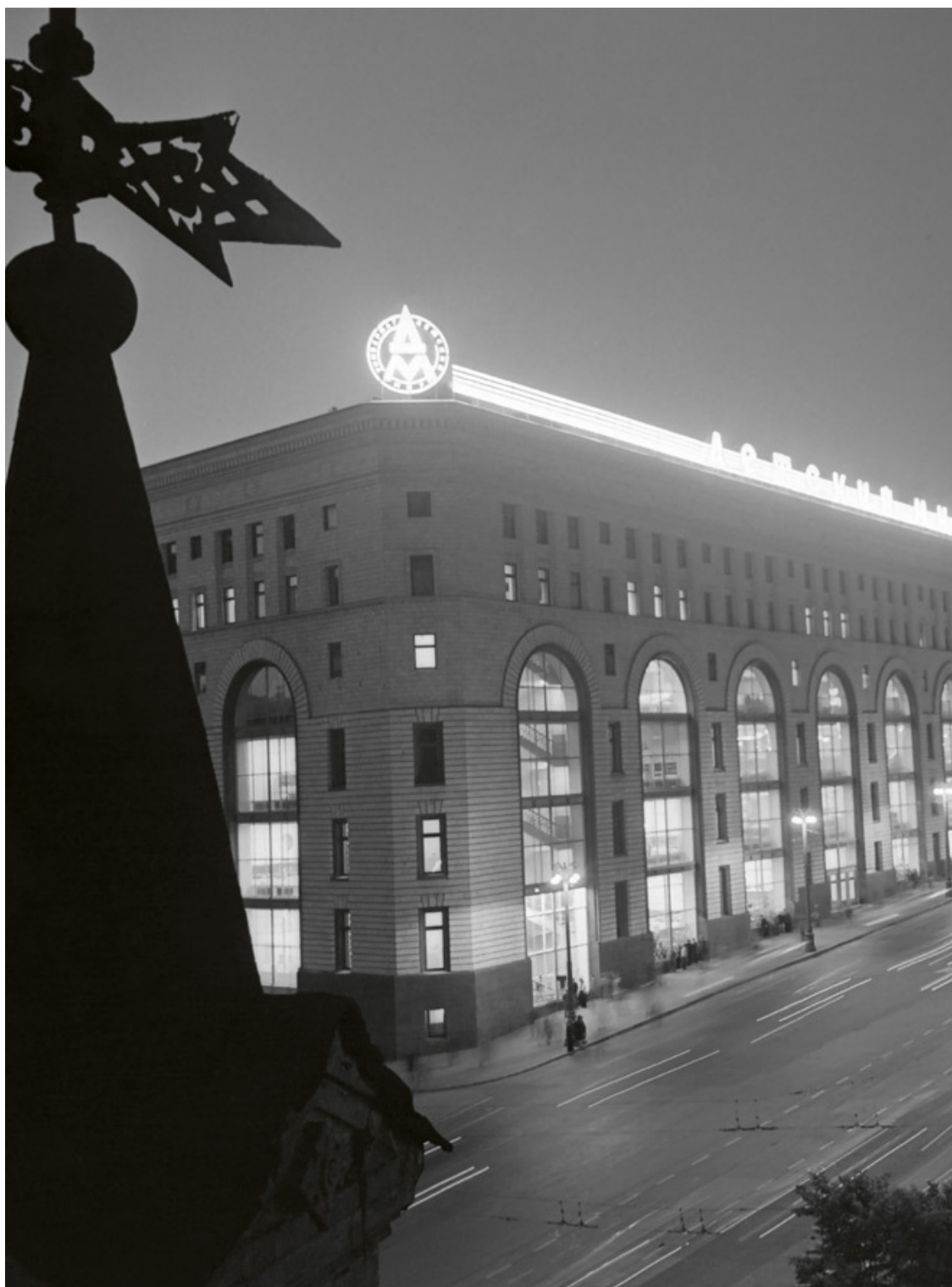
Вид на «Детский мир» на площади Дзержинского со стороны проспекта Маркса. Июнь 1957.