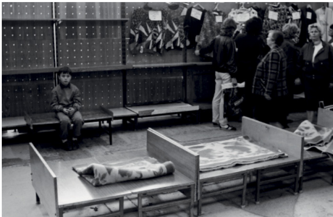
Пустые полки в период дефицита. 1991 г.