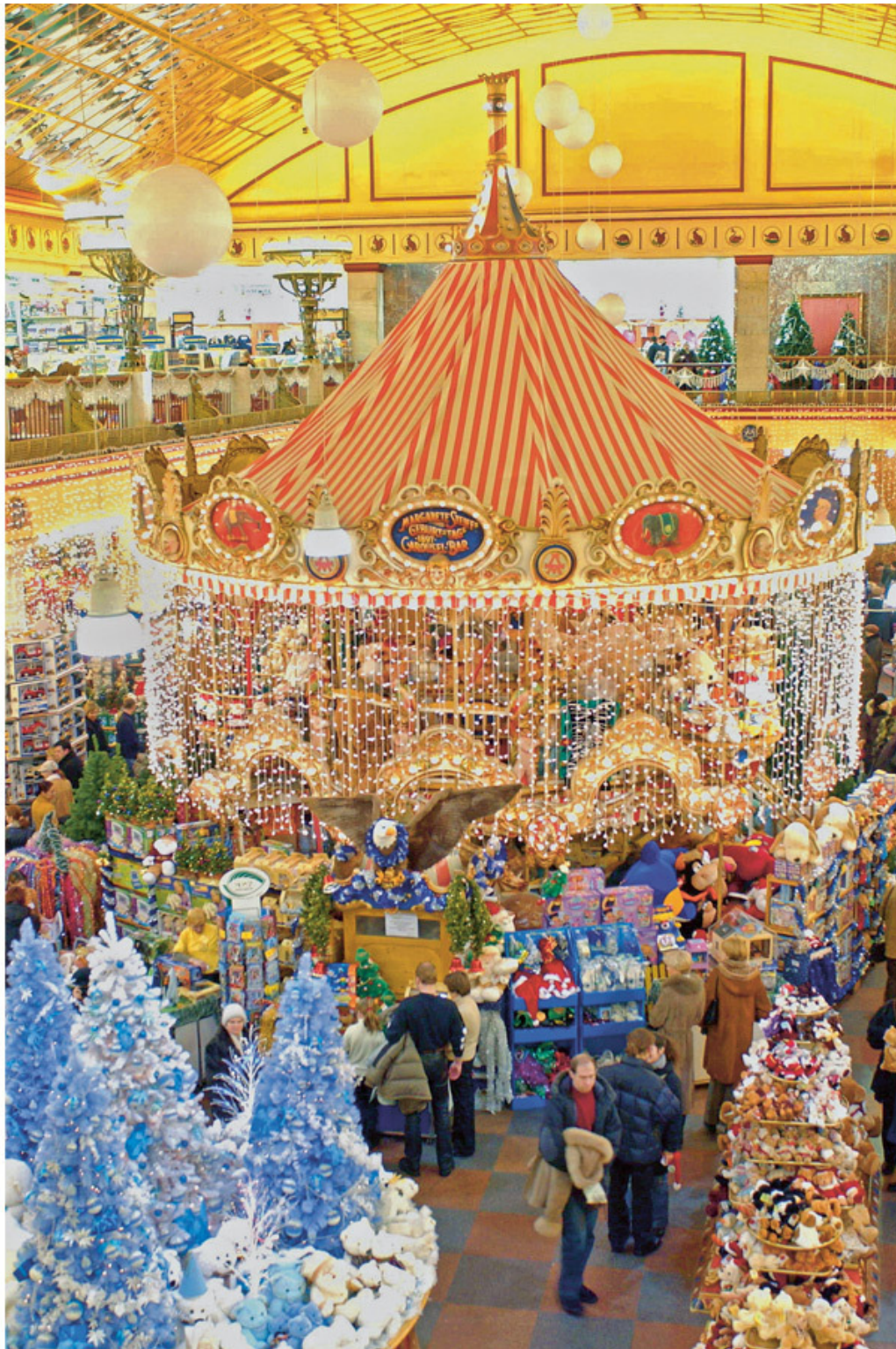
Магазин «Детский мир» в канун Нового года.

Первую задачу выполнить удалось. Коллектив сохранили.