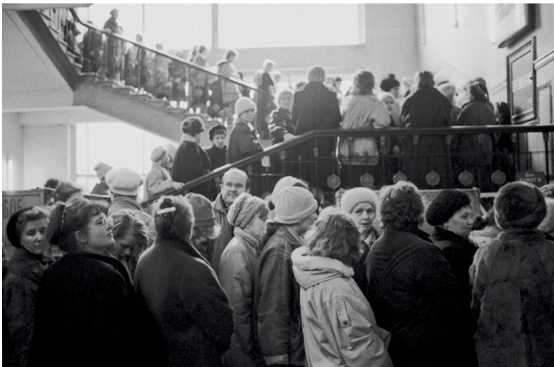
Очереди на лестницах «Детского мира». 1991 г.

Но основной торг разворачивался перед магазином на тротуарах Лубянской площади. Там образовался настоящий стихийный рынок. Торговали с рук и с картонных коробок. Продавали не просто детские товары, а всё на свете, вплоть до газировки, губной помады и ваучеров.