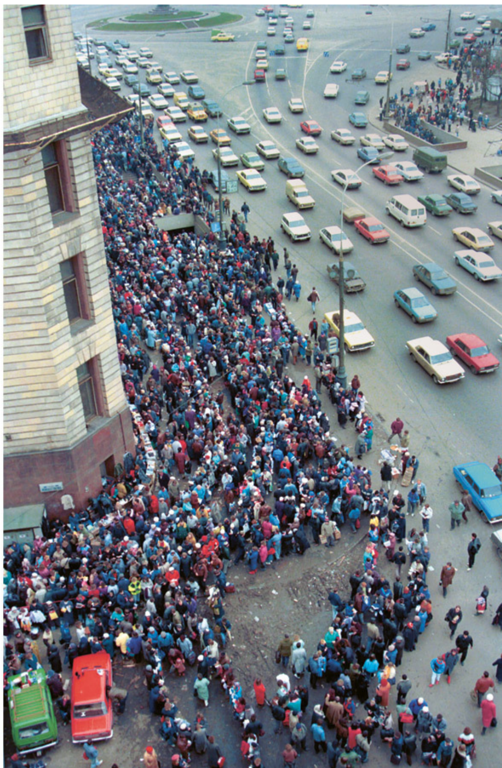
Торговля с рук у центрального универмага «Детский мир». 1991 г.