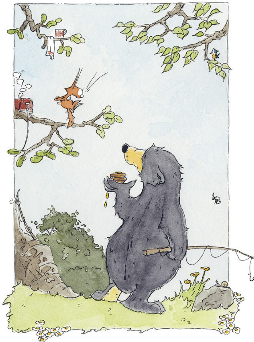
Перекус на двоих