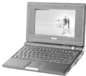
Рис. 1.1. Нетбук Asus Eee PC

1.1), MSI Wind, HHP 2133 Mini-Note, Acer Aspire One, Dell Inspiron Mini. Их технические характеристики просто не позволяют устанавливать и запускать современные операционные системы, в то время как Windows XP вполне подходит для решения поставленных перед нетбуками задач, а именно – работа в сети, создание и редактирование документов.