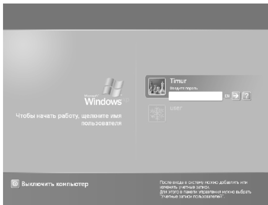
Рис. 1.2. Окно приветствия Windows XP

После того как произведена регистрация, система начинает работу, и на экране отобразится рабочий стол Windows, на котором располагается значок Корзина . После этого система полностью готова к работе.