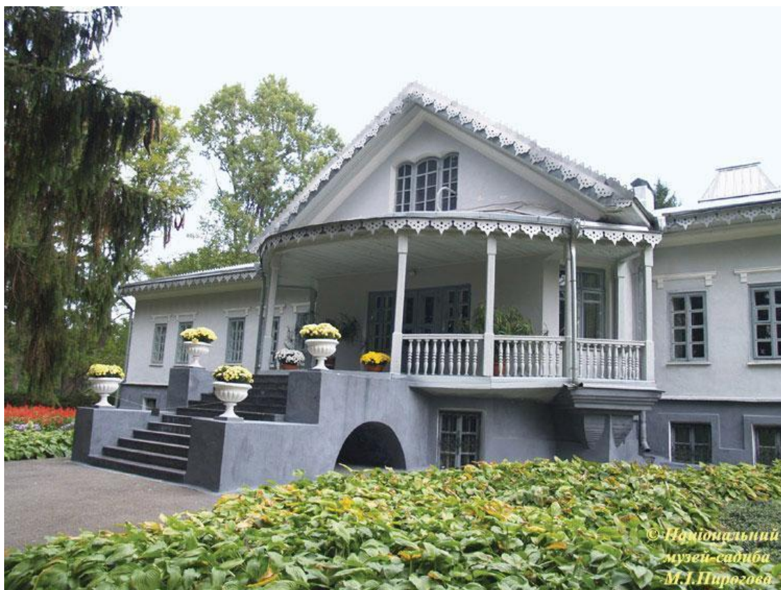
Дом-музей Н. И. Пирогова под Винницей