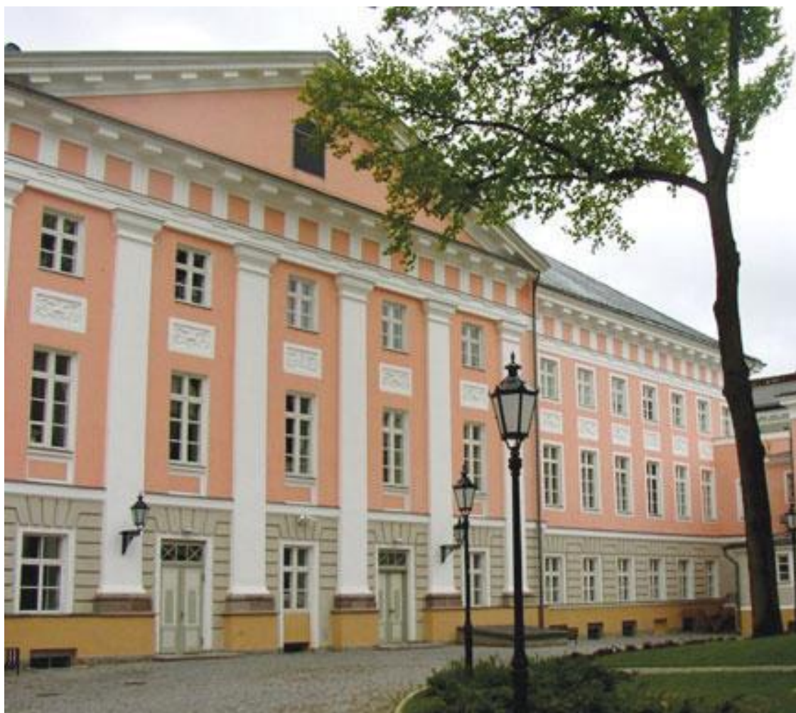
Университет в Тарту, где преподавал профессор Н. И. Пирогов