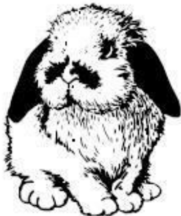
Иллюстрация на обложке ITA GOTDARK