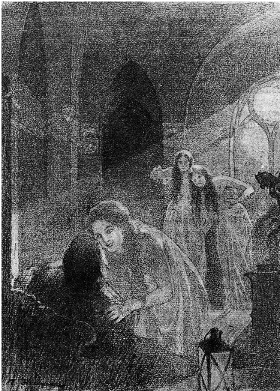
Блондинка встала на колени и наклонилась ко мне в возжелении.