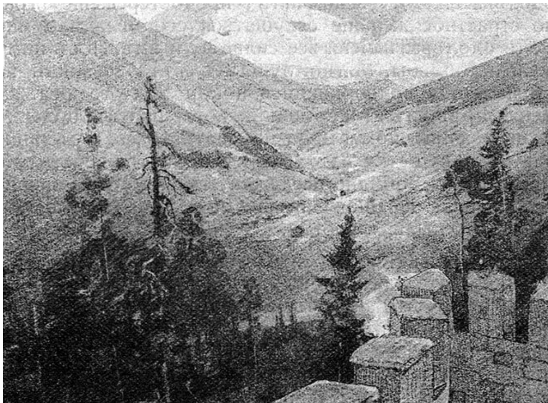
Замок расположен на самом краю пропасти.