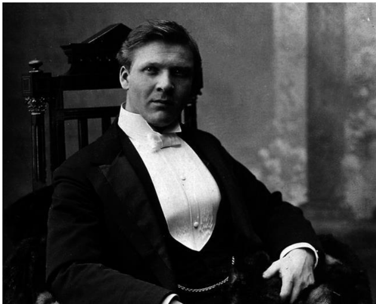
Федор Иванович Шаляпин

тошек в лесу да перекрестить ими все двери и окна в избе и всякую щель, где какая есть. Так она и сделала, послушав добрых людей. Вот прилетел змей, а в избу-то попасть и не может! Обратился со зла огненным конем да так лягнул ворота, что целое полотнище свалил.