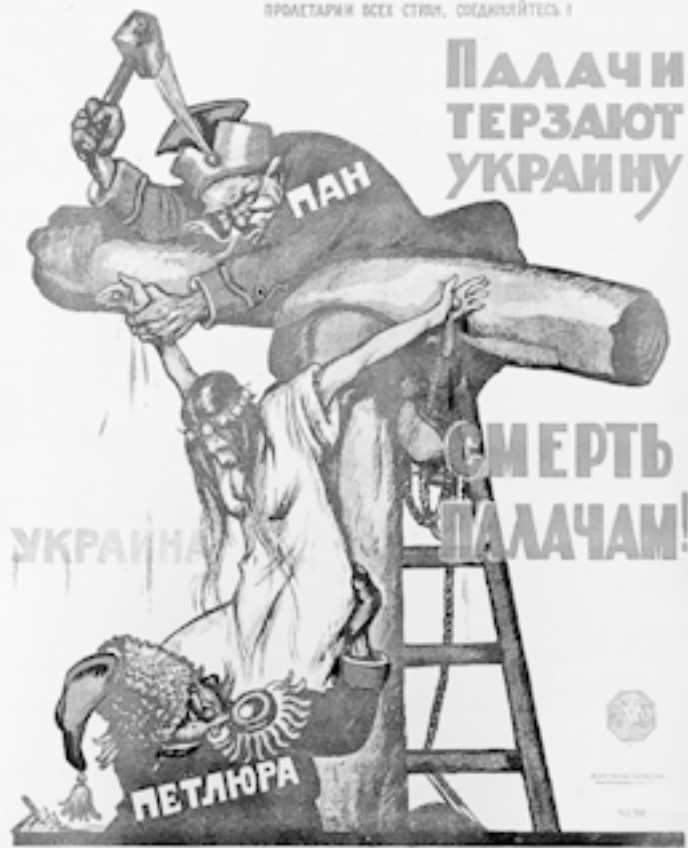
Виктор Дени. Плакат «Палачи терзают Украину. Смерть палачам!», 1920 год.