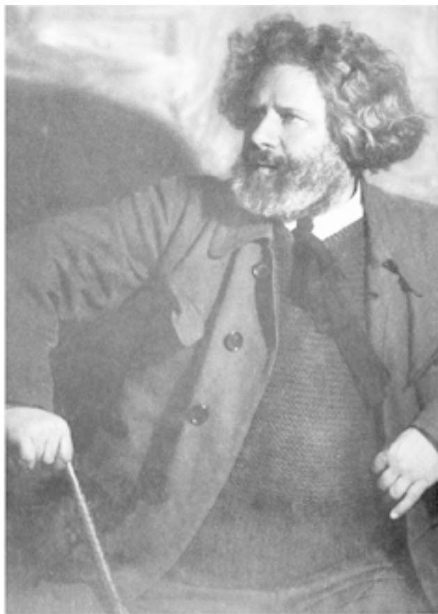
Максимилиан Волошин. 1920-е годы. Волошин одним из первых высоко оценил «Белую гвардию»