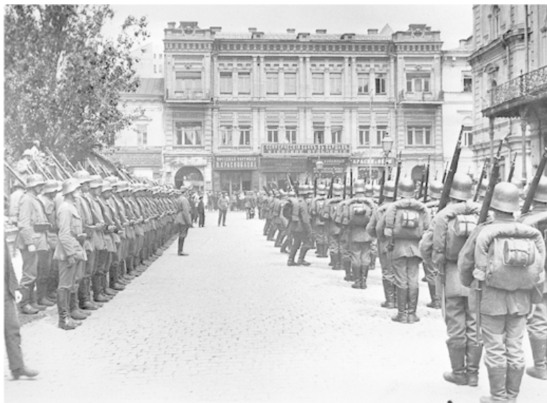
Немецкие войска в Киеве. Март 1918 года

гвардейцев, но силы города и деревни были заведомо неравны (у Булгакова: «Кто запретил формирование русской армии? Гетман. А теперь, когда ухватило кота поперек живота, так начали формировать русскую армию? В двух шагах враг, а они дружины, штабы?»). В конечном счете немецкая армия не только не спасает мир Турбиных, но даже ускоряет его гибель.