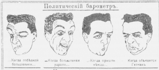
Карикатура из одесского юмористического еженедельника журнала «Буржуй». №7, май 1918 года. Политический барометр. Выражения лица одессита, когда победили большевики, удрали большевики, пришли немцы, объявился гетман

В «Белой гвардии» украинский язык звучит в основном в связи с наступающими на Город силами Петлюры. На украинский переходят герои, пытающиеся уцелеть при столкновении с ними, – так делает, к примеру, Василиса в эпизоде ограбления («Я, собственно, мирный житель... не знаю, почему же ко мне? У меня – ничего, – Василиса мучительно хотел сказать по-украински и сказал, – нема») или еврей Фельдман перед смертью («Я, панове, мирный житель. Жинка родит. Мне до бабки треба»). Герои, желающие устро-