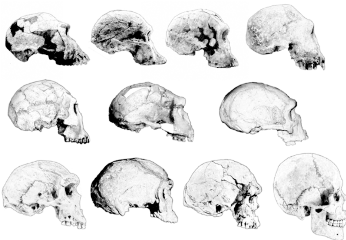
Рис. 4. Черепа гоминид (слева направо, сверху вниз): ардипитек, австралопитек африканский, человек умелый, человек работающий (Грузия), человек работающий (Восточная Африка), человек прямоходящий, человек гейдельбергский (Франция), человек гейдельбергский (Южная Африка), Homo helmei , Homo sapiens idaltu , Homo sapiens sapiens

По мнению многих исследователей, анатомический критерий здесь в принципе невозможен. Человек – это примат, изготавливающий орудия, поэтому грань проходит не по анатомии, а по культуре, и судить о «человечности» гоминида проще всего по наличию рядом с его останками орудий. Но это, конечно, не гарантирует того, что скелет обязательно принадлежит создателю орудий. И кроме того, часты находки костных останков безо всяких орудий – как быть с ними?