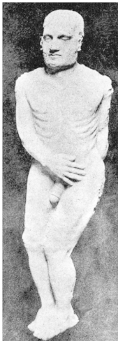
Рис. 2. Кардиффский великан, Сиракузы (США), 1869 г.

Эта версия и одержала верх. Тысячи зевак стекались в Кардифф, чтобы увидеть «американского Голиафа», и с каждого хозяин находки брал по 50 центов! Великан из Кардиффа наделал много шума, побывал в нескольких музеях, и, прежде чем обман удалось разоблачить, мистификаторы заработали на «допотопном гиганте» 100 000 долларов.