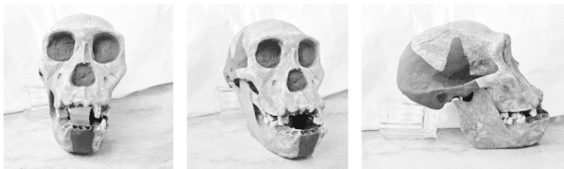
Рис. 3. Череп Australopithecus sediba (подросток), Южная Африка, 2 млн лет назад

Разумеется, и те и другие, в отличие от мифотворцев, прекрасно понимают, что грань «Номо / не Номо» – по большому счету условность.