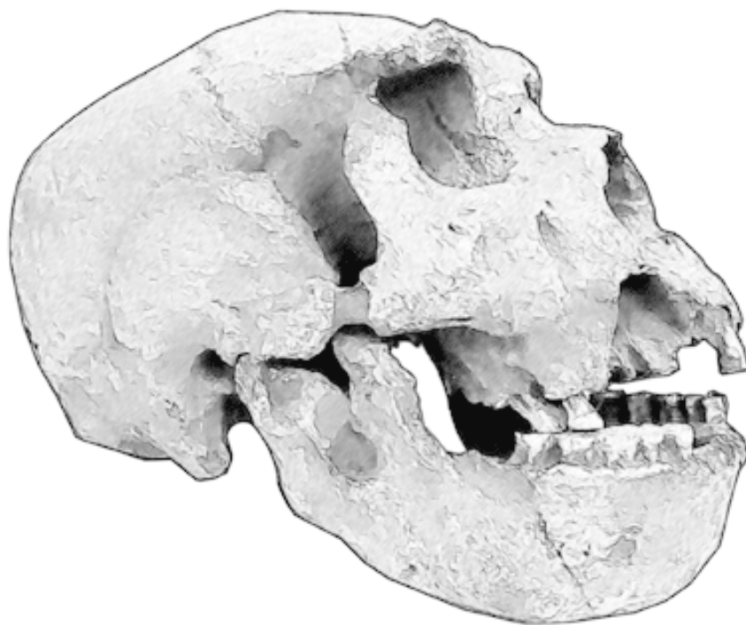
Рис. 1. Сима де лос Уэсос, череп 5