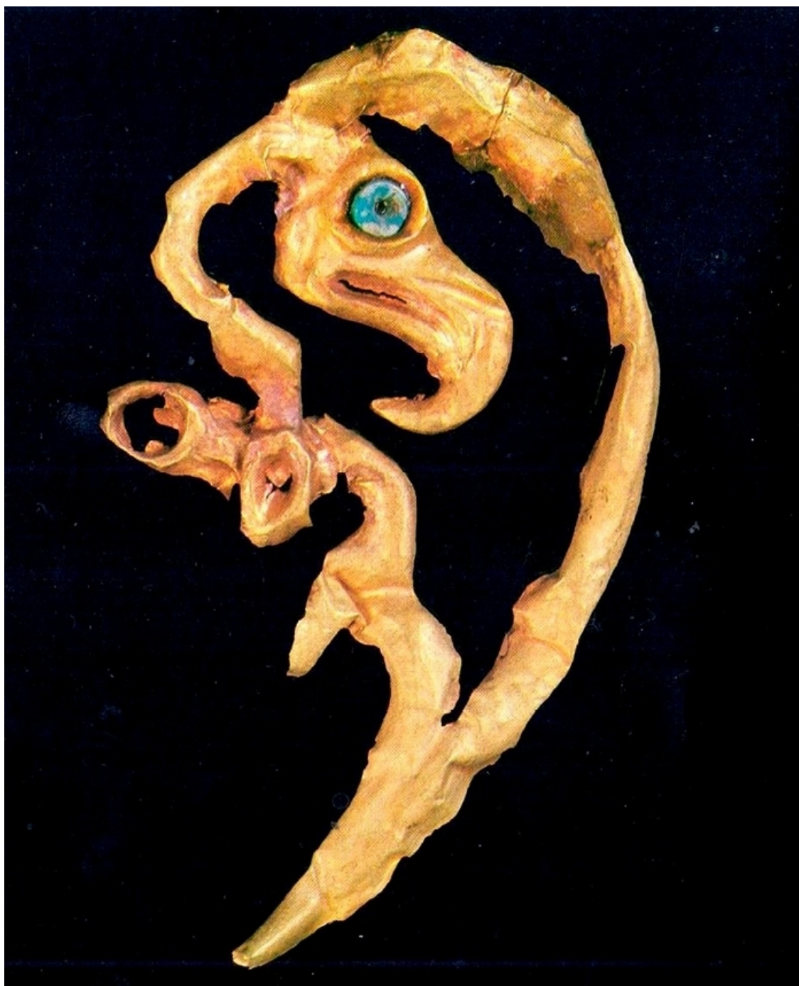
Рис. 3. Бляшка в виде орла. VII–VI вв. до н. э. Чиликтинский курган № 5. Золото, штамп, гравировка.

Признаки отмеченного художественного направления, проблески которого наметились ещё в эпоху бронзы, имеют широкий ареал распространения: от Египта и Месопотамии, Закавказья и Северного Кавказа в III-ем тыс. до н. э., Передней Азии, Индии и Китая во II тыс. до н. э. до Поволжья, Приуралья, Средней Азии и Южной Сибири в I тыс. до н. э. Везде в отмеченных регионах археологические раскопки демонстрируют общие особенности (с некоторыми вариациями) звериного стиля, что объяснимо связью произведений ювелирного искусства с идеологией правящей элиты. Звериный стиль был не массовым, а элитарным искусством, выражавшим идеологию власти [5, с. 170]. Очевидно, эти предметы, являясь знаком-эмблемой правящих сил, играли роль своеобразной пропаганды власти. Утверждался определенный