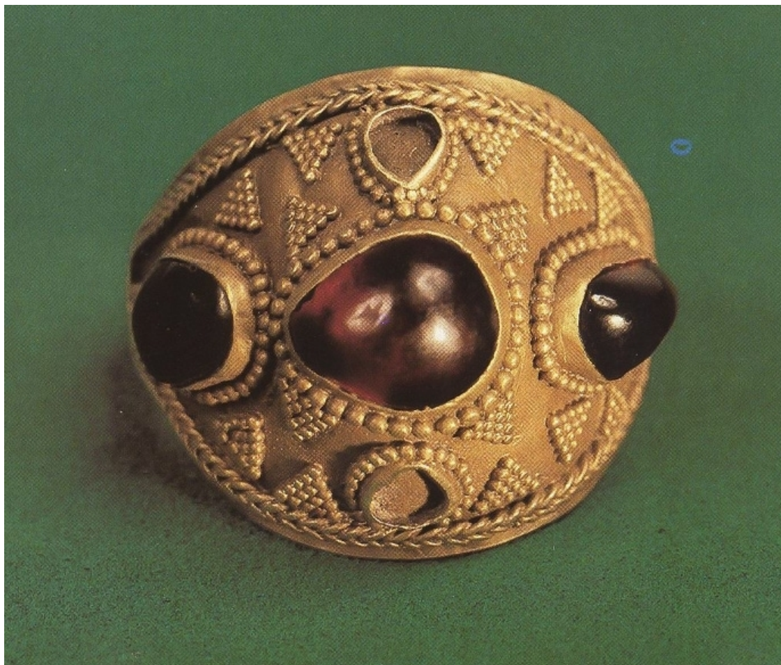
Рис. 6. Перстень. III–V вв. Могильник Лебедевка. Уральская обл. Серебро, листовое золото, гранаты, ковка, плакировка, зернь, инкрустация