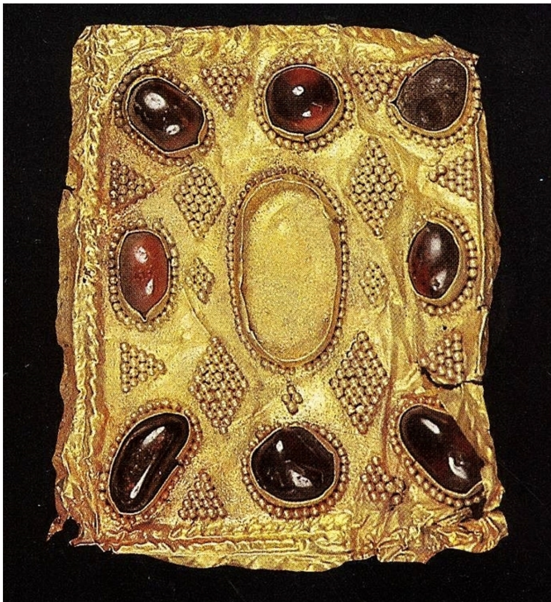
Рис. 5. Обкладка прямоугольная. III–V вв. Случайная находка у озера Боровое. Серебро, листовое золото, гранат, сердолик, штамп, зернь, инкрустация.