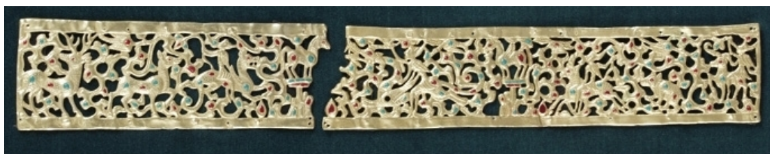
Рис. 4. Диадема. II–I вв. до н. э. Случайная находка в урочище Каргалы. Золото, паста, бирюза, гранаты, штамповка, гравировка, инкрустация.

С рубежа III–II вв. до н. э. и по V в. н. э. в Семиречье и Южном Казахстане образовалось раннеклассовое объединение усуней, а на средней Сырдарье – объединение племен кангюй. Материалы ряда могильников усуней демонстрируют появление инкрустационного стиля, который начинает соседствовать со «звериным» стилем, продолжающим присутствовать в образной структуре изделий последующих художественных направлений благодаря преемственности сакских традиций. В предметах по-прежнему присутствуют зооморфные мотивы, но они обогащаются включением в декор пышных растительных узоров и вставок из цветных камней: бирюзы, граната. Однако сочетание золотистого металла, голубой бирюзы и самоцветов красного цвета выдвинуло на первый план иной принцип достижения художественного эффекта. Яркая полихромия стала ведущим признаком украшений этого периода, что наиболее выразительно отражено в украшениях – диадеме, перстнях, серьгах, бляхах, обнаруженных в погребении усуньской жрицы в урочище Каргалы близ Алматы [7, с. 158–169]. Среди найденных предметов особо выделяется золотая ажурная диадема в виде прямоугольной полосы со сложной сюжетной композицией, образный строй которой отражает мифологические представления усуней (рис. 4). Воспроизведенные животные, птицы, люди, олицетворяющие многогранность мира, объединены пышной растительностью в гармоничное целое.