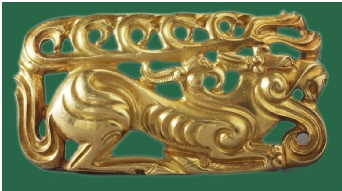
Рис. 2. Бляшка «Лось». V–IV вв. до н. э. Курган Иссык. Золото, литье, гравировка.

в результате эстетизации тотемистических представлений, мир животных (птицы, домашние животные и хищники) становится не только доминирующей изобразительной темой, он – главный ассоциативный художественный язык для отображения всех аспектов универсума (рис. 2, 3).