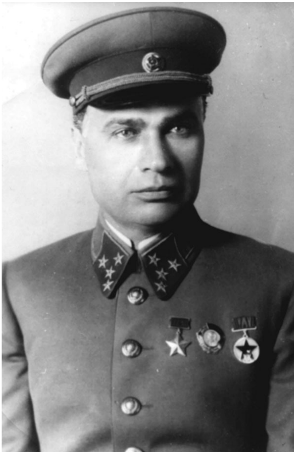
Генерал-полковник М. П.Кирпонос