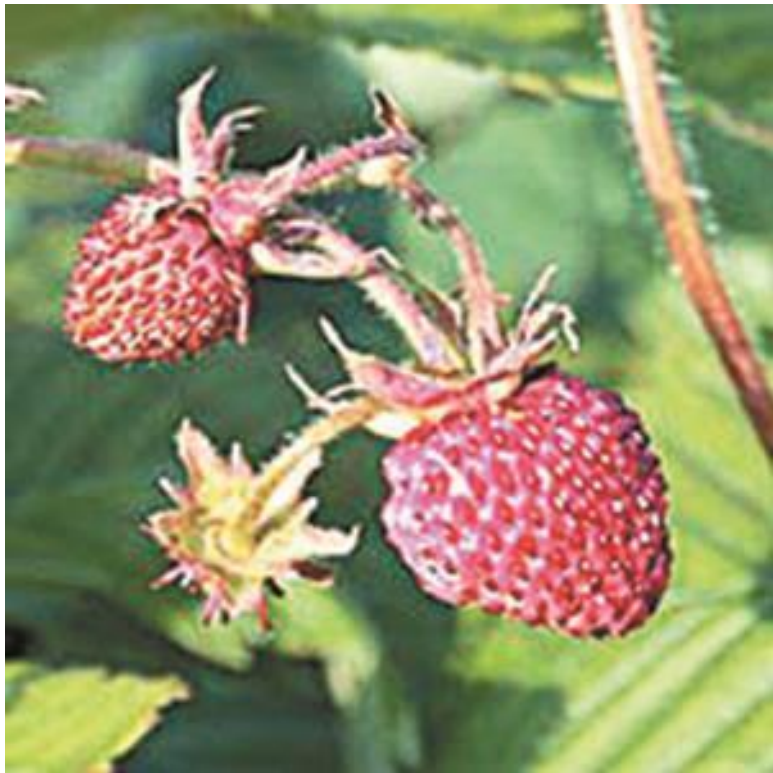
Клубника европейская, или земляника мускатная: а) цветки; б) плоды