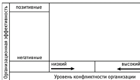
Рис. 1 Мера конфликтности (начало)

Ремарка. Большинство опрошенных сразу говорили, что высокий уровень конфликтности определяет низкую эффективность организации. Однако для многих было откровением, что низкая конфликтность имеет те же последствия: организация, в которой нет конфликтов, останавливается в развитии. И ключ здесь – в балансе позитивных и негативных последствий.