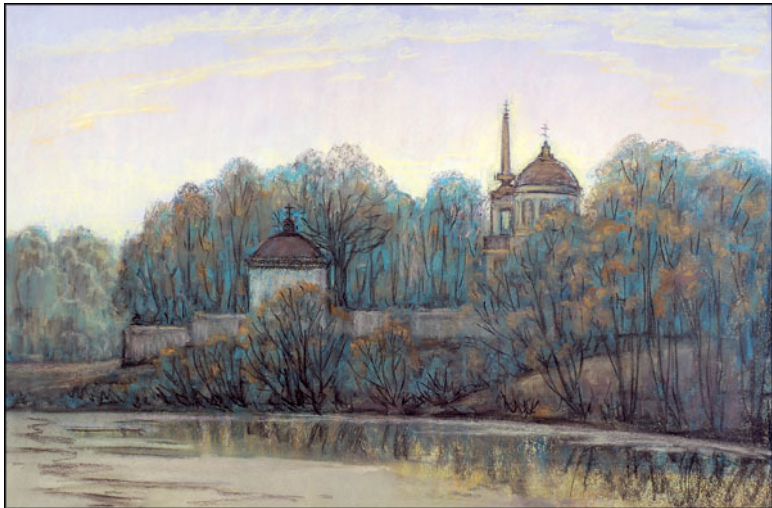
Вид на сельскую церковь. 2006 г. Лермонтово