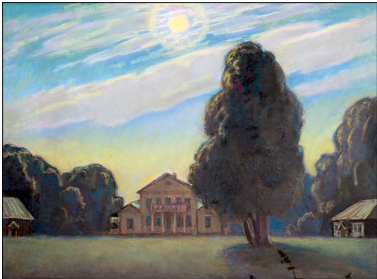
Тарханы. Лунная ночь. 1991 г. Лермонтово