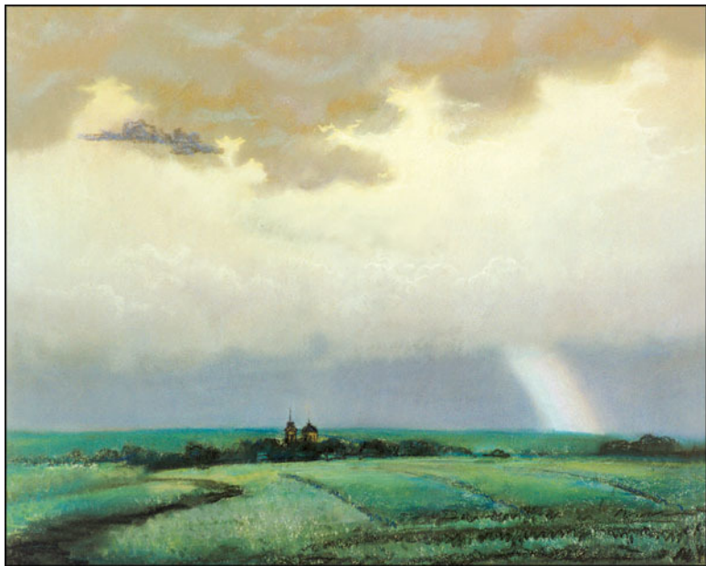
После грозы. Кропотово. 1985 г.

Господи, спаси нас и помилуй, Охрани от зависти и зла. Чтоб не стыдно было над могилой Говорить нам добрые слова.