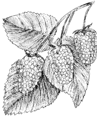
Рис. 1. Ягода малины

стой и черной малины. Имеет тот же характер роста, что и черная малина, и размножается тем же самым способом. Распространена в Америке.