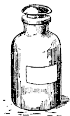
Рис. 3. Банка