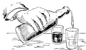
Рис. 7. Превращение сока в воду

Я переливаю сок в другой стакан, и он снова превращается в воду (рис. 7). Но пить воду эту нельзя. И вот почему.