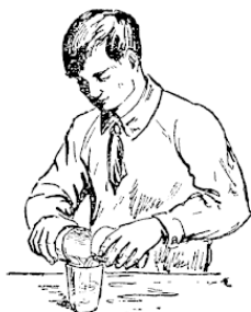
Рис. 5. Молоко из воды

Поэтому, если, повторяя мой опыт, вы не захотите испортить его эффект, немедленно прячьте стакан с «молоком» в стол и переходите к другим фокусам. Я же открою вам секрет превращения. В стаканах, которые я держал в руках, была налита не вода, а прозрачные водные растворы: в одном – обыкновенной поваренной соли ( хлористого натрия ), в другом – ляписа (азотнокислого серебра) . Имейте в виду, что ляпис ядовит, обращайтесь с ним с особенной осторожностью, в руки не берите, вынимайте его из баночки, в которой храните, пинцетом (рис. 6); баночка должна быть из темного стекла, так как на свету ляпис разлагается. Растворять азотнокислое серебро необходимо в дистиллированной воде, так как в обыкновенной воде оно дает муть.