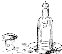
Рис. 1. Дым исчезает в бутылке и появляется в стакане

Поднятие воды под бутылкой объясняется тем, что часть находящегося в ней кислорода соединилась с магнием. Ну а причина появления дыма в закрытом стакане? На дно его я до начала опыта капнул несколько капель нашатырного спирта, а ту сторону блюдца, которая прикрывает стакан, смочил соляной кислотой .