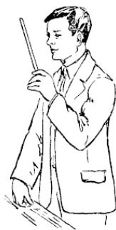
Рис. 8. «Волшебная палочка»

В крупинке воска, которую я отделил от целого куска, мной был предварительно спрятан крошечный кристаллик роданистого аммония . В воду заранее добавлено несколько капель хлорного железа с соблюдением осторожности, чтобы она не пожелтела. В противном случае следует вылить часть раствора и долить стакан чистой водой. Когда вы сказали «десять», я слегка надавил концом палочки на дно стакана: этим я раздавил кристаллик роданистого аммония, освободив его от восковой оболочки. После вступления в реакцию роданистого аммония с хлорным железом получилось роданистое железо , оно и окрасило воду в кроваво-красный цвет.