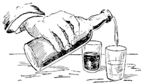
Рис. 7. Превращение сока в воду

Я переливаю сок в другой стакан, и он снова превращается в воду (рис. 7). Но пить воду эту нельзя. И вот почему.