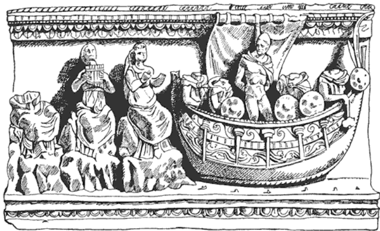
Рис. 2. Барельеф, украшающий фронт саркофага в Вольтерре, II в. до н. э. Улисс слушает пение сирен.

В то же время в Палестрине (древняя Пренеста ) примерно в 25 милях к востоку от Рима был случайно найден древний шедевр бронзового рельефа – сундук Фикорони, теперь выставленный в Этруском музее на вилле Джулии в Риме. Антиквар Франческо Фикорони в 1738 г. обнаружил в земле этого древнего римско-этруского города огромный цилиндрический сундук из бронзы с рельефными изображениями на крышке и боках, иллюстрирующими, к великой радости Фикорони, различные эпизоды мифа об аргонавтах. Корабль «Арго» («Стремительный»), управляемый отважными