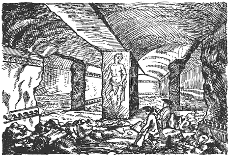
Рис. 3. Открытие гробницы Тифона. С гравюры Байреса в «Гипогеях Тарквинии», часть I, илл. 4.

гих свидетельств о некоторых из них. Тарквиния также привлекала внимание художников и граверов, порой весьма знаменитых. Сохранились рисунки, показывающие, как выглядели гробницы в момент их открытия, Джеймса Байреса, английского художника, дружившего с Пиранези (рис. 1, 3, 6, 19). Их издали в Лондоне в 1842 г. под названием «Гипогейи, или Погребальные пещеры Тарквинии». Пиранези тоже, как мы увидим, интересовался погребениями в Кортоне.