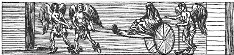
Рис. 1. Фриз из Гроттадель-Кардинале. Крылатые гении везут умершую женщину к Аиду. С гравюры

Демпстер, великолепно знавший древнюю литературу, попытался изложить историю древних тосканцев, исходя в первую очередь из письменных источников. Его работа была проиллюстрирована 93 превосходными гравюрами, воспроизводящими различные этрусские документы. Флорентийский сенатор Буонаротти снабдил их объяснениями и гипотезами в качестве комментария к этому первому скромному своду памятников Этрурии. Так было положено начало археологическим и историческим исследованиям в Тоскане.