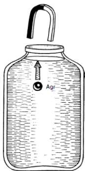
Рис. 2. Движение шарика навстречу магниту

на горлышко банки сильный магнит. И... шарик, не достигнув дна, двинется обратно навстречу магниту (см. рис. 2). Что это? Антигравитация? Видимо... А как ещё по-другому назвать силу, которая заставляет шарик преодолевать силу притяжения Земли?