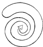
Рис. 4. Центростремительное ускорение

Наступил новый лунный месяц. Питание должно помочь организму восстанавливаться после потерь четвертой фазы и новолуния. Энергия сейчас пойдёт, в этом плане можно быть спокойным – сие от нас не зависит. Но это будет энергия ян, давящая на организм снаружи. Если не помните из физики про центростремительное ускорение, то приведу простенькую схемку (см. рис. 4).