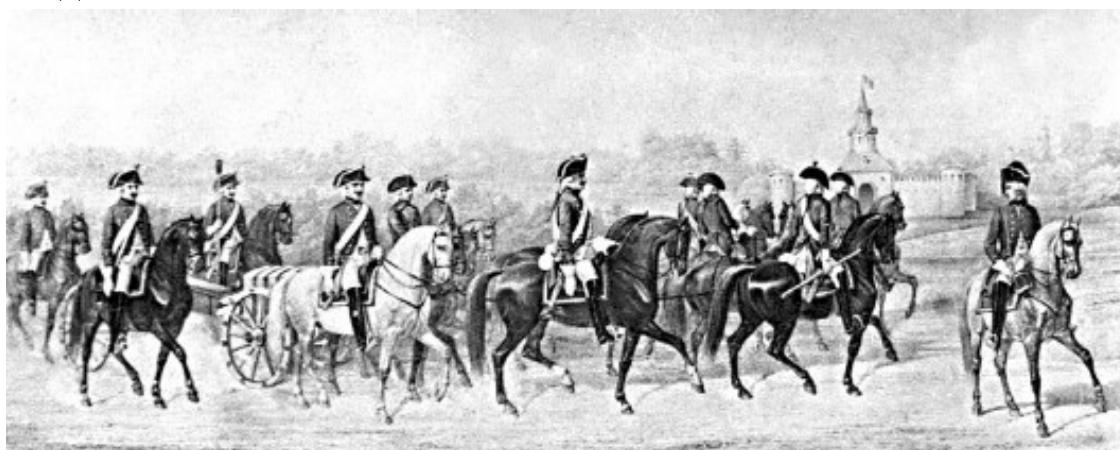
Конная артиллерия Гатчинских войск