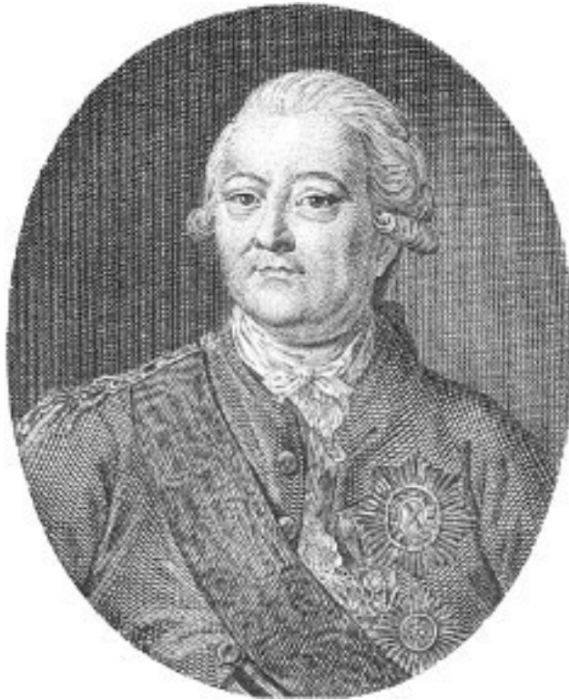
П. И. Панин

Еще одним желанным собеседником, прошедшим не одно сражение, был для молодого Павла полковник Михаил Федотович Каменский (1738–1809), будущий Генерал-Фельдмаршал, участник Семилетней войны, причем прошедший кампании 1758 и 1759 гг. волонтером во французской армии, человек, храбрость которого сделала его известным лично Фридриху Великому 49 .