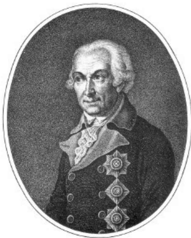
Н. В. Репнин

Еще в 1769 г. возникает длившаяся много лет переписка между Павлом и П. И. Паниным 66 . Вторую редакцию «Рассуждения», переработанного в 1778 г., Павел с письмом от 11 октября того же года отправил Панину 67 3 января 1779 г. Цесаревич представил Панину вместе с письмом трактат «Мысли о военной части» 68 . Еще одним адресатом, с которым Павел постоянно обсуждал различные военные вопросы, был талантливый русский военачальник и дипломат генерал-аншеф князь Николай Васильевич Репнин (1734–1801) 69 . В переписке двух полководцев и Великого Князя серьезно обсуждались вопросы комплектования и квартирования армии, обороны границ и боевой подготовки 70 . «Ясно, что не гр. П. И. Панин и кн. Н. В. Репнин побуждали Цесаревича проектировать преобразования по части военной или гражданской, но сам он искал дружеских ответов на занимавшие его вопросы», – писал об этой переписке Я. Л. Барсков 71 . Приблизительно в то же время Павлом была составлена записка, специально касающаяся преобразований в артиллерии. Многие из ее положений впоследствии были реализованы 72 .