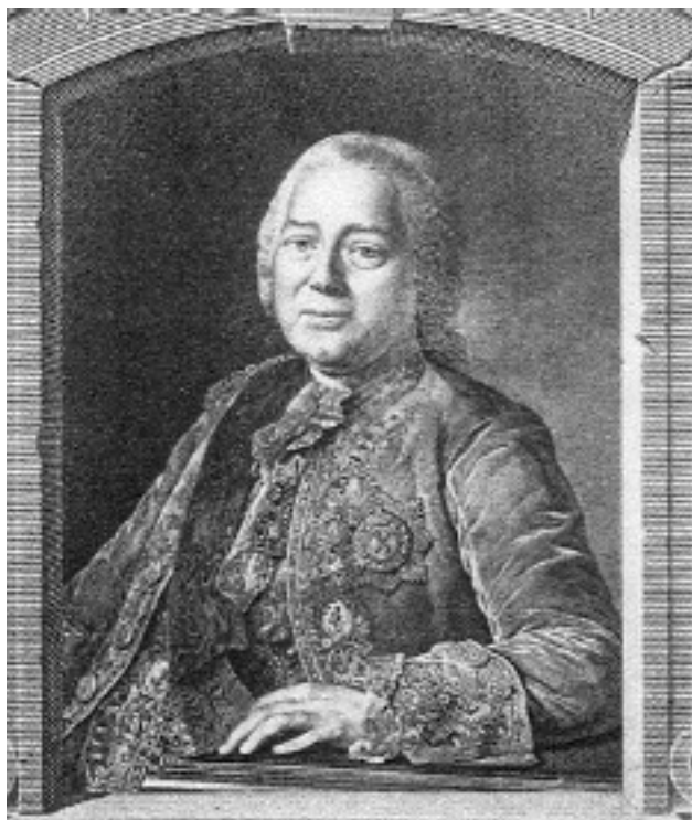
Н. И. Панин

Значительную роль в увлечении Павла армией сыграли и некоторые из военных деятелей екатерининской эпохи, близко общавшиеся с Цесаревичем, прежде всего родной брат воспитателя Павла – графа Никиты Ивановича Панина – генерал-аншеф граф Петр Иванович Панин (1721–1789). Ко времени знакомства с Великим Князем принявший участие в Русско-турецкой (1735–1739), Русско-шведской (1741–1743) и Семилетней (1756–1763) войнах, неоднократно проявивший себя как искусный полководец и в Русско-турецкую войну 1769–1774 гг. 47 , Панин «постоянно посещал великого князя до отъезда в армию в 1769 году и содействовал в немалой степени развитию военных наклонностей в юном наследнике. В своих беседах Петр Иванович охотно касался также современных военных порядков и критически... относился к военным порядкам и мероприятиям Императрицы Екатерины. Подобные суждения не прошли для Цесаревича без последствий и, оставив глубокий след в его впечатлительном уме, несомненно, повлияли на склад его понятий», – отмечал Н. К. Шильдер 48 .