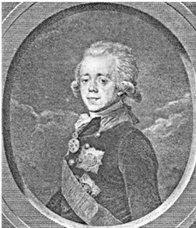
Павел I. 1798–1800 гг.

батальонов, численность и состав которых постоянно менялись, а также егерская рота (сформирована и упразднена в 1793-м, восстановлена в 1794 г.) 2 .