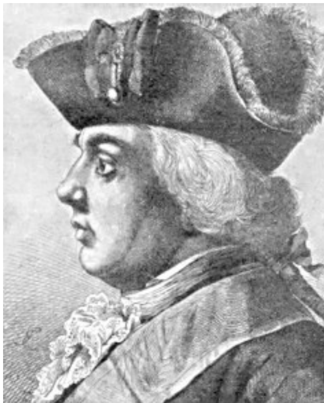
Фридрих Вильгельм I