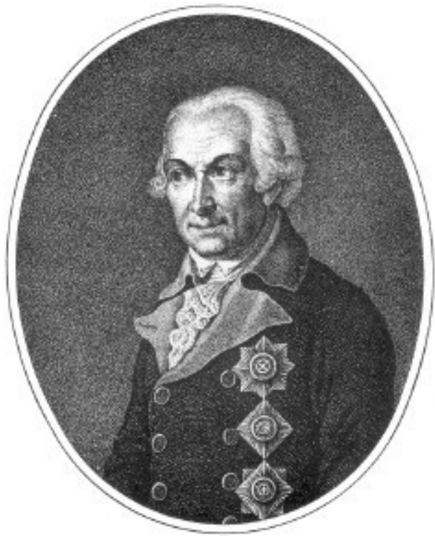
Н. В. Репнин

Еще в 1769 г. возникает длившаяся много лет переписка между Павлом и П. И. Паниным 66 . Вторую редакцию «Рассуждения», переработанного в 1778 г., Павел с пись-