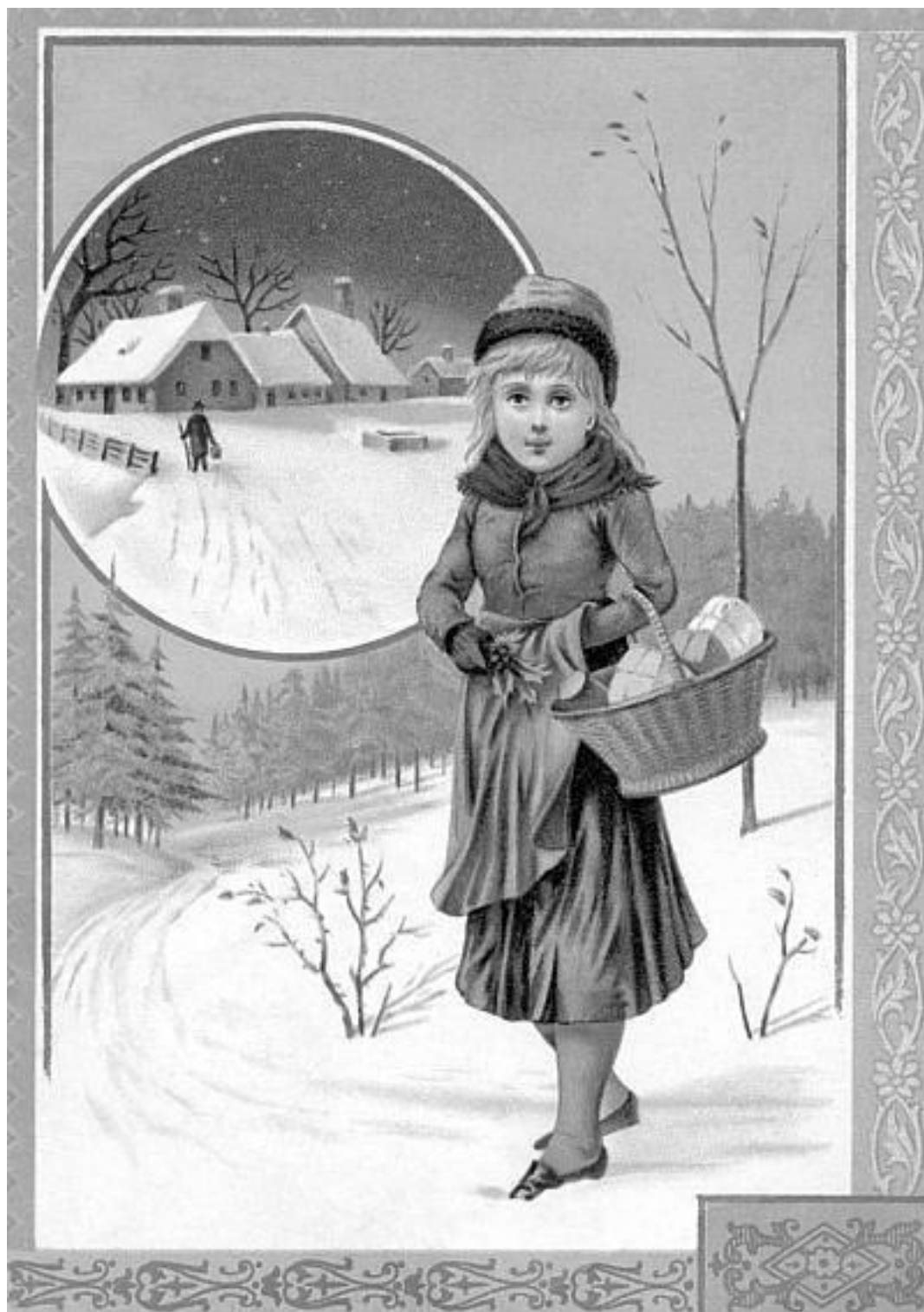
Может быть так выглядела героиня сказки «Морозко». Поздравительная карточка 1880-х годов

Оказывается, это не просто символ зимы, а древнее славянское божество. Не только у русских оно имеется, но и у других славянских народов по всей Европе. И тогда становится понятным, почему Морозко имеет возможность и дарить, и миловать, и наказывать, как все древние божества.