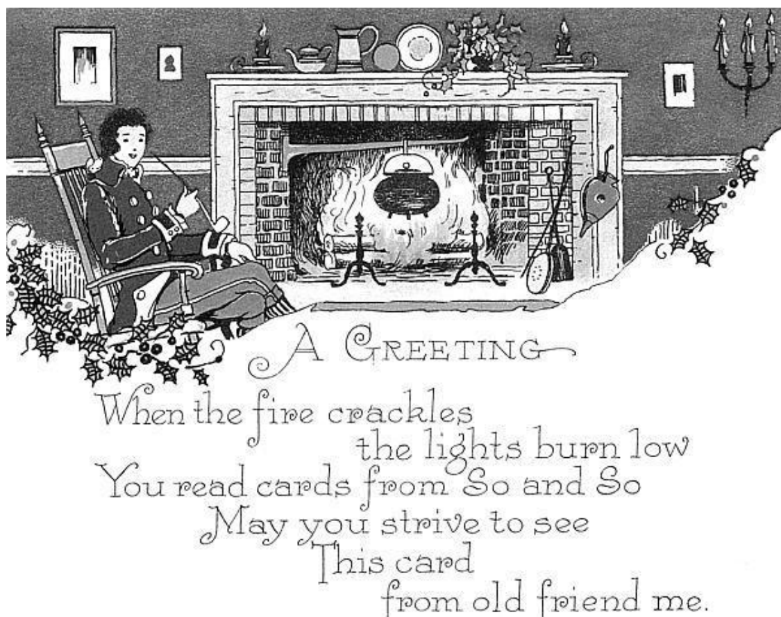
Старинная рождественская открытка

Так что же получается – в чем заключается идея рождественской и новогодней сказки? Неужели в том, чтобы появиться под праздники? Да, но не только! Время выхода в свет таких книг – скорее издательская традиция.