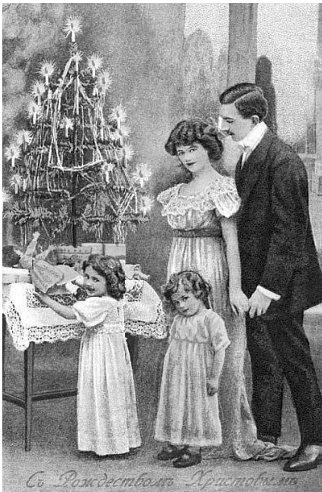
Ёлка с рождественскими подарками. Старинная открытка 1903 года