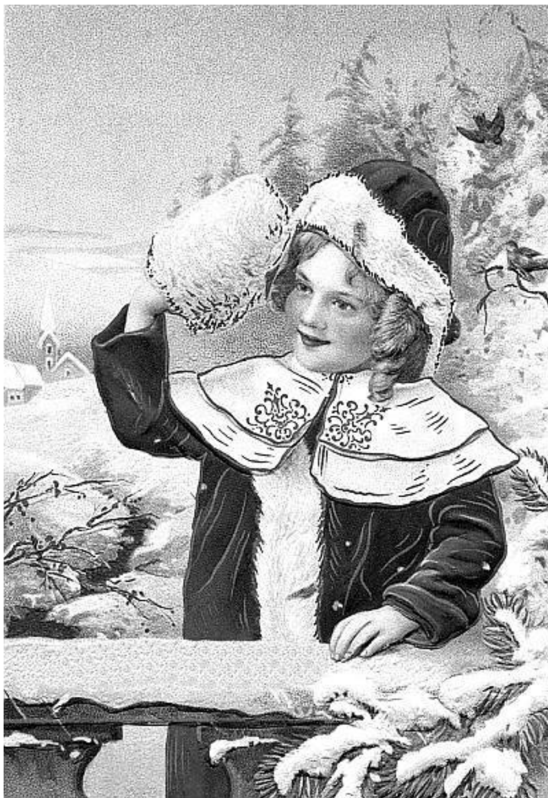
В таком наряде мороз не страшен. Старинная открытка

То есть получается, что Морозу объясняли, что в доме все труженики, никто от работы не отлынивает. Вот и в сказке Морозко наградил труженицу-сестру, добрую старикову дочку. Злую же да жадную старухину дочь-бездельницу наказал.