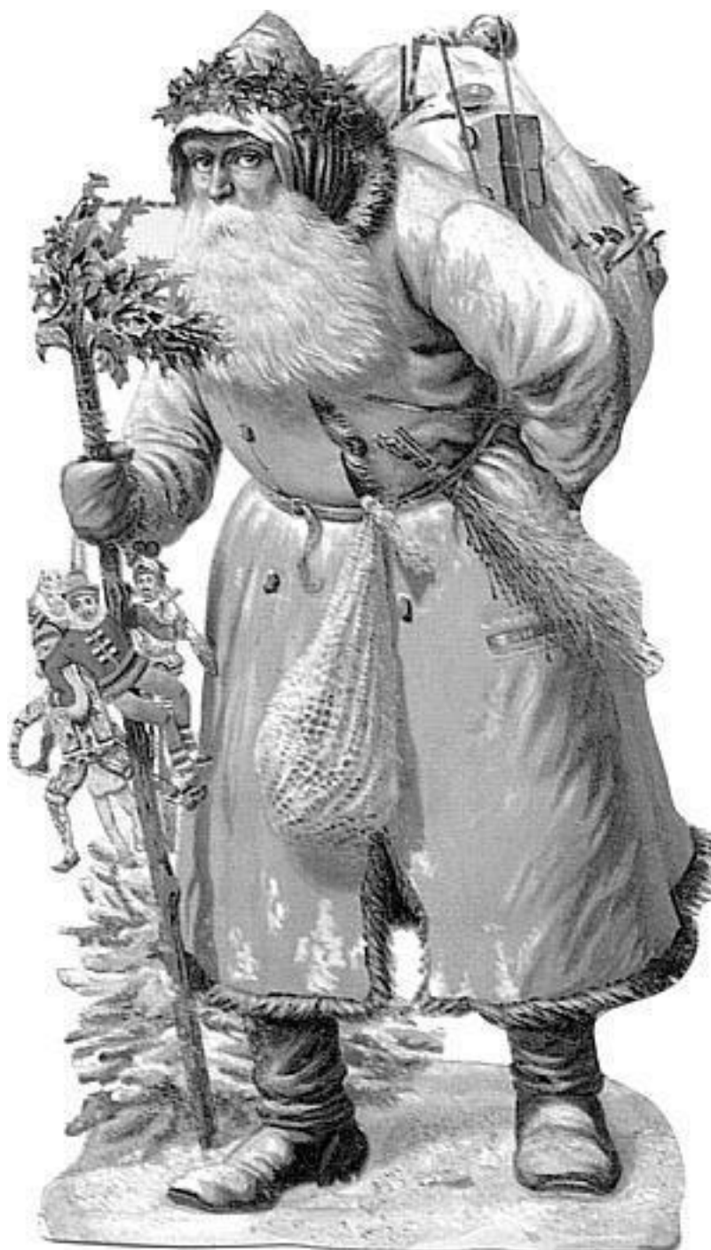
Дед Мороз. Вырезная фигурка. За типичный «форсовый» кушак заткнута метла, чтобы разметать снег на пути

А знаете, какое еще есть значение от «мора-мороки»? Мороковать (мораковать) – разбираться, помаленьку учиться чему-то, смекать, понемногу смыслить в чем-то. Это не результат, а процесс – надо что-то познавать. У Даля приведены примеры: «Он грамоте морокует» (разбирается), «Я морокую, о чем идет речь у вас» (понимаю).