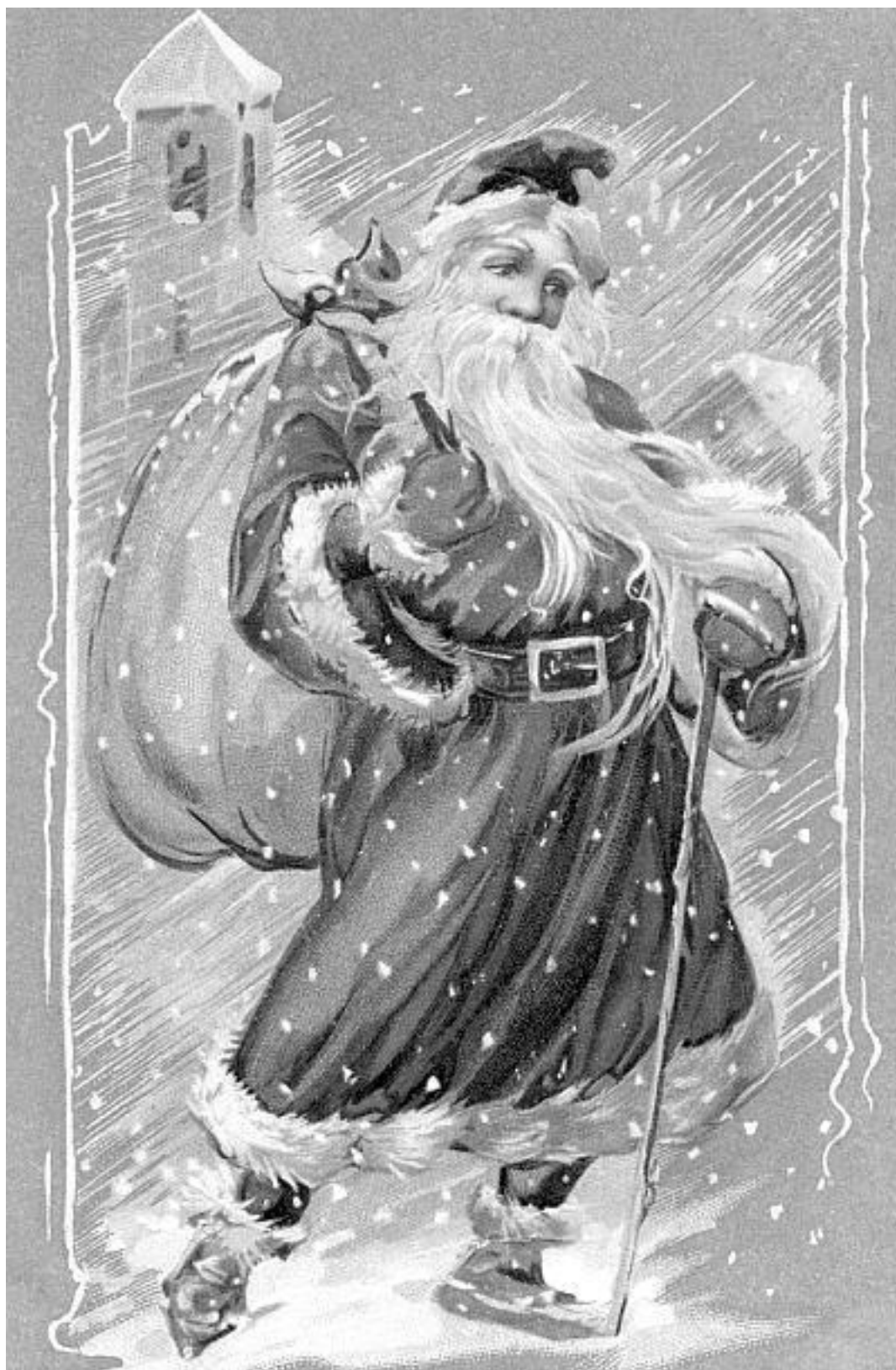
Ну чем не Морозко? Старинная открытка

И ведь не поверишь, что оба сценариста прожили жизнь трудно – до войны были репрессированы. Пьесы Эрдмана, хлесткие, ироничные, снимались с репертуара. Его блестящий «Самоубийца», которого мечтал поставить новатор Всеволод Мейерхольд, оказался запрещен. Вольпин вообще был мало кому известен, хотя это именно он создал сценарий культового