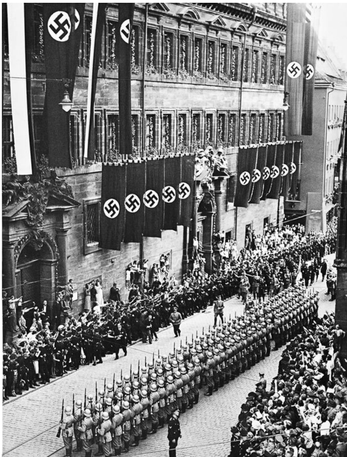
На партийном съезде в Нюрнберге в 1937 г. Адольф Гитлер провозгласил тысячелетнее будущее Третьего рейха