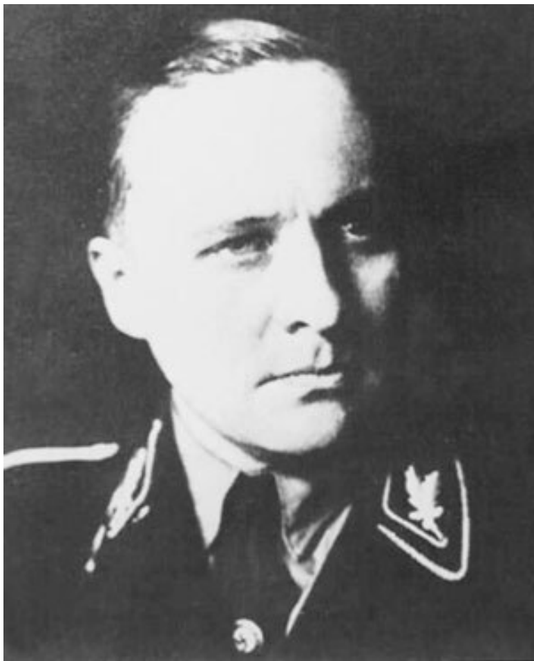
Рихард Вальтер Дарре, идеолог расовой теории нацизма, глава Главного управления СС по вопросам расы и поселе-