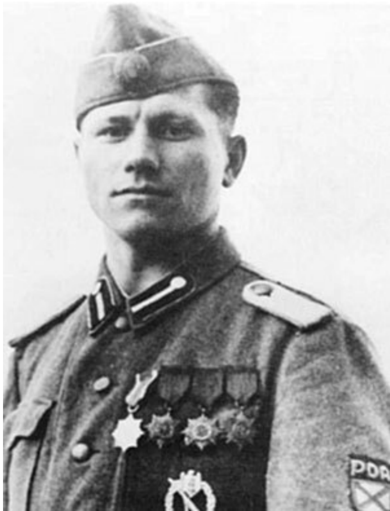
Военнослужащий власовской Российской освободитель-