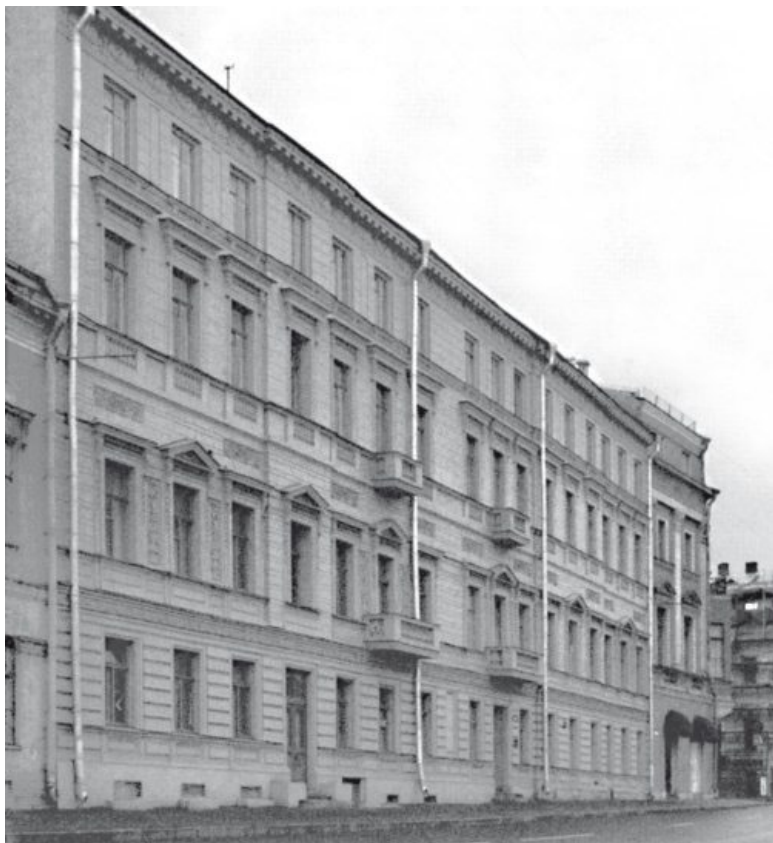
Английская набережная, дом 34

который просил его как шурина, «чтобы он при дворе о всем происходившем сообщал».