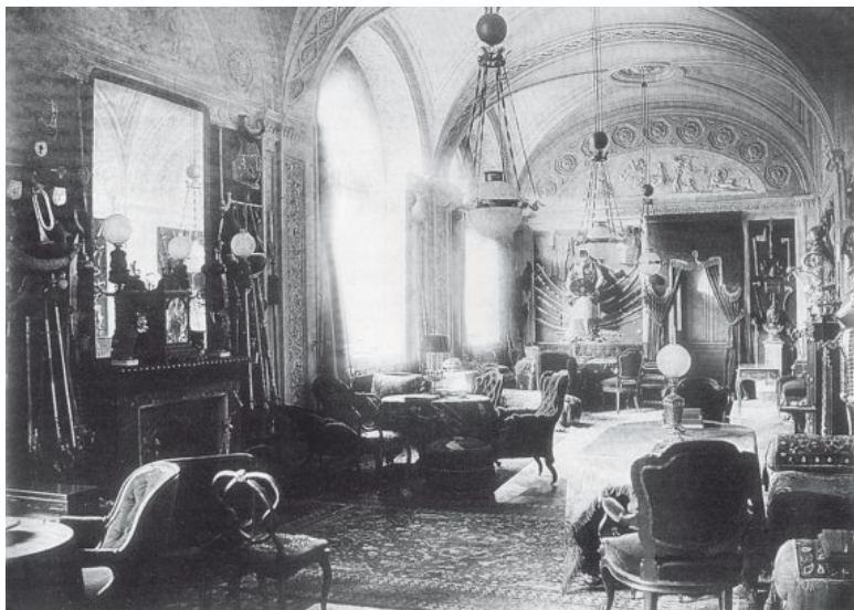
Арсенальная галерея в доме Ф.И. Паскевича. 1860-е гг.