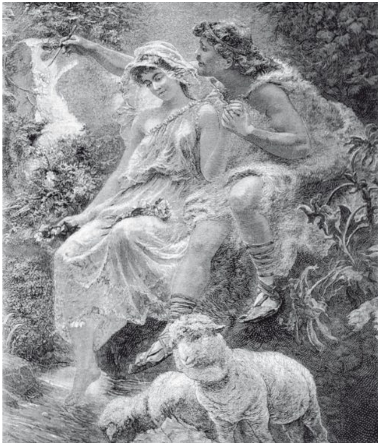
К.Е. Маковский. Панно «Живопись». Фрагмент