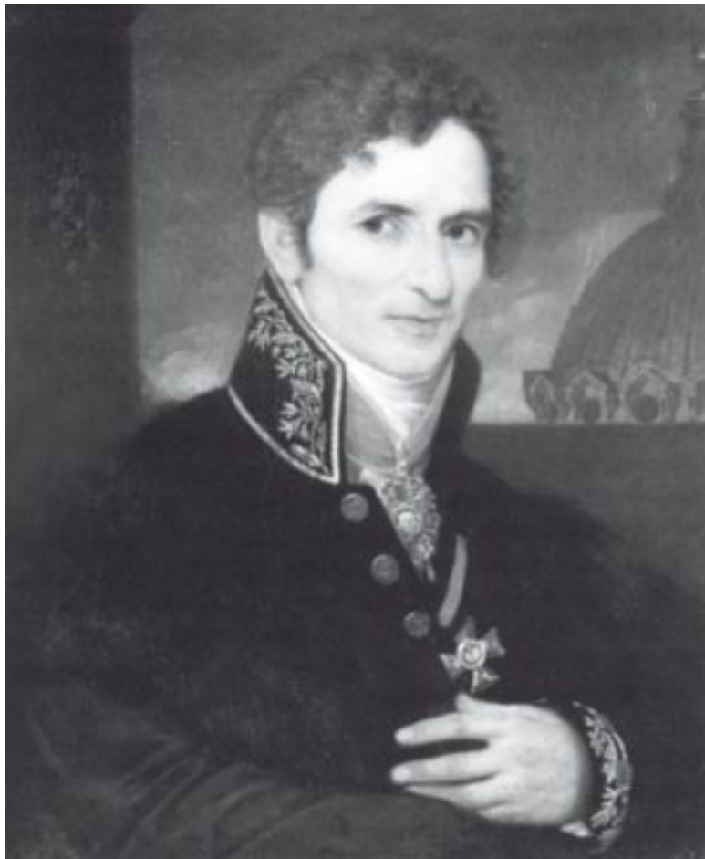
А.Н. Воронихин. Неизв. художник. После 1811 г.