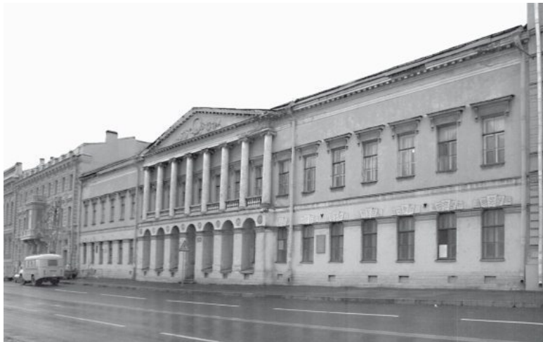
Английская набережная, дом 32