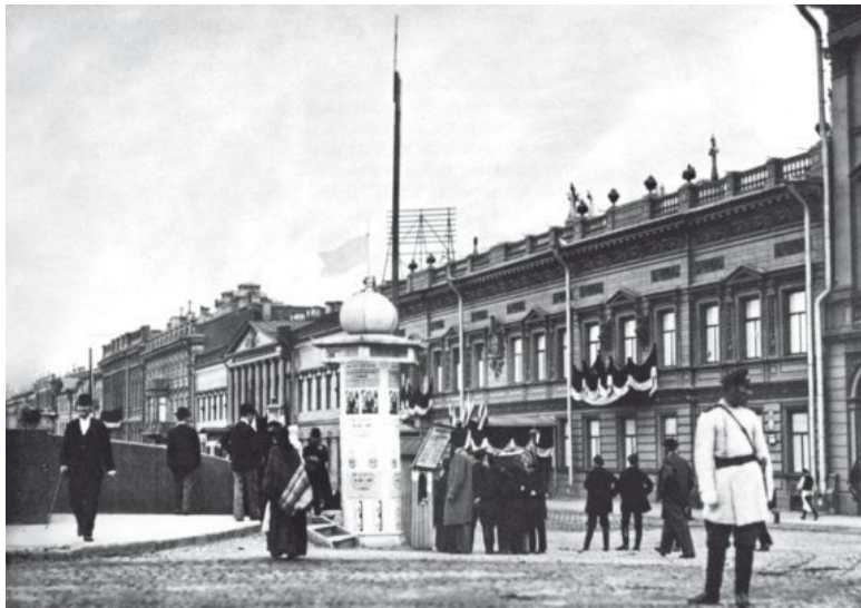
Английская набережная, дома 32–34. Фото 1900-х гг.