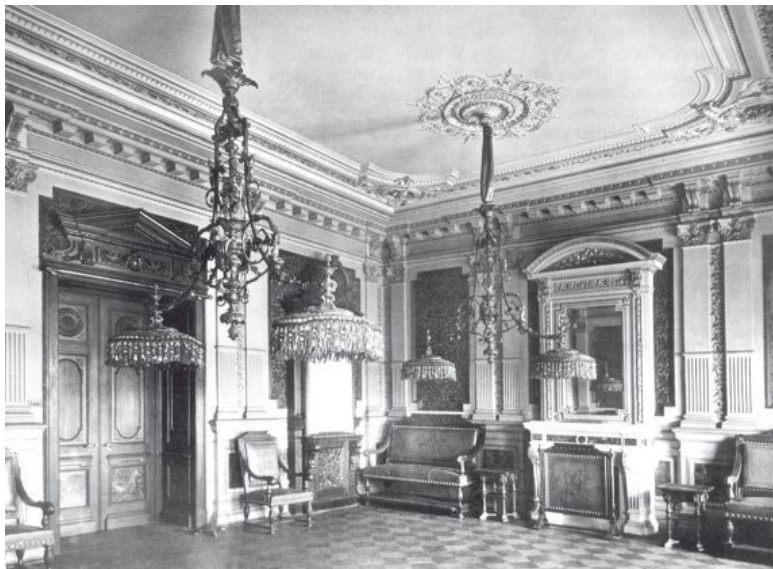
Приемная в особняке П.П. Дервиза. Фото начала XX в.

Любвеобильный красавец-гусар в первый раз женился в 1891 году, в последний – в 1920-е годы, и каждый раз это были неравные браки.