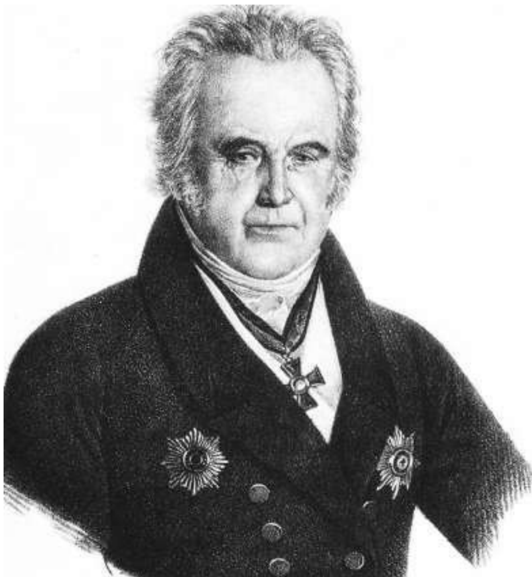
Граф Василий Сергеевич Шереметев