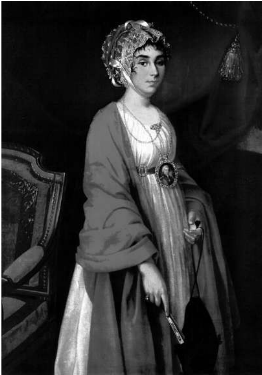
Прасковья Ивановна Ковалева-Жемчугова, графиня Шереметева

дневные занятия: изучение иностранных языков – французского и итальянского, актерского искусства. Будущие актрисы кусковского театра учились игре на музыкальных инструментах, пению и танцам у лучших артистов.