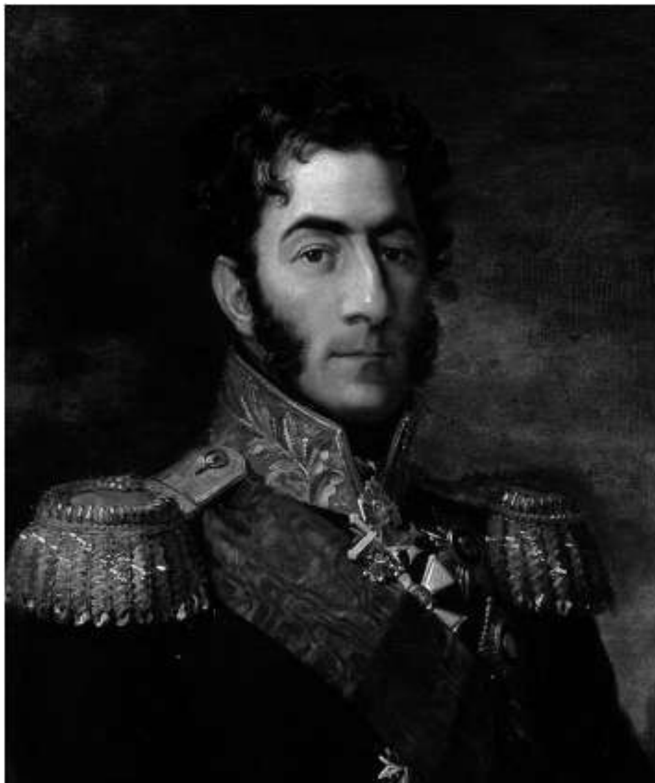
Князь Петр Иванович Багратион

Городская усадьба Ростопчина располагалась неподалеку от Странноприимного дома, на Сретенке – ныне Большая Лубянка, 14. Здесь записывали в ряды Московского ополчения... Сюда после Бородинской битвы привезли раненого генерала Петра Ивановича Багратиона.