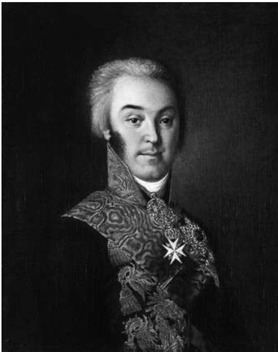
Граф Николай Петрович Шереметев

«Во всех веках и у всех народов бедные люди, не имеющие способов к пропитанию, болезнями удрученные и от многочисленности семейств своих бедствующие, обращали на себя предусмотрительную внимательность государей и возбуждали сострадание избыточествующих граждан...» – писал императору Александру I в апреле 1803 года граф Николай Петрович Шереметев, внук сподвижника Петра I фельдмаршала Бориса Петровича Шереметева, под блистательным началом которого русская армия одержала победу в Полтавской битве. «Руководствуясь непреложными обязанностями закона Христианского и следуя побуждениям патриотического усердия, – продолжал он в обращении к государю, – издавна положил я за непременно учредить в Москве Странноприимный дом для содержания в оном на моем иждивении