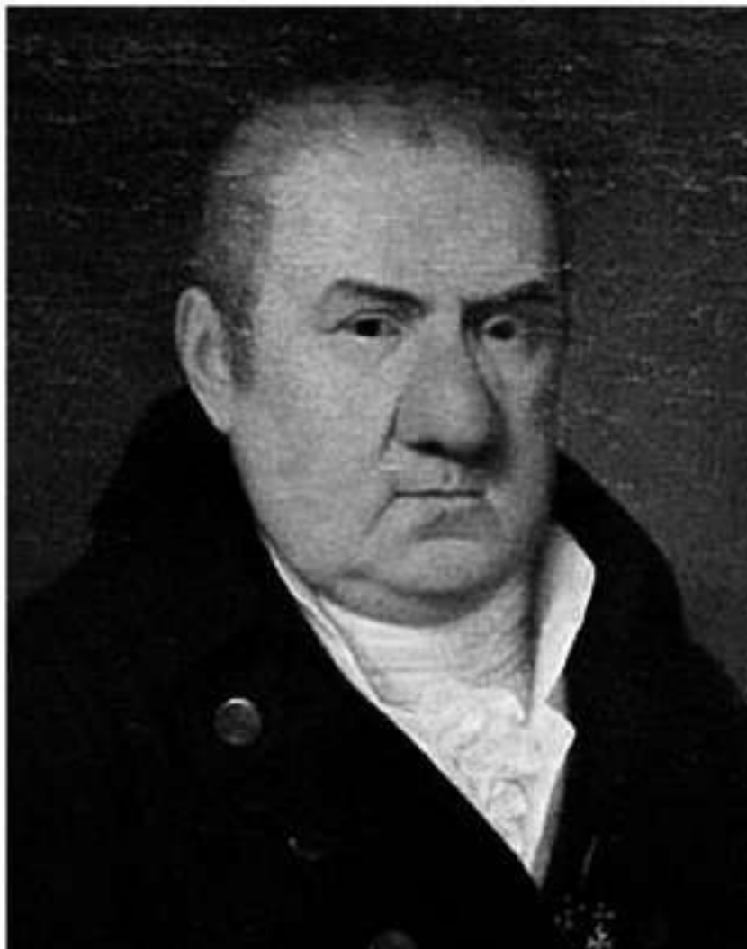
Джакомо Антонио Доменико Кваренги

В «Переписке графа Николая Петровича Шереметева и его завещательном письме своему сыну» (изданной в 1896 году) можно было прочесть: граф нашел в будущей жене «украшенный добродетелью разум, искренность, человеколюбие, постоянство, верность... привязанность ко святой вере и усерднейшее богопочитание. Сии качества пленили меня больше, нежели красота ее; ибо они сильнее всех внешних прелестей и чрезвычайно редки. Они заставили меня поправить светское предубеждение в рассуждении знатности рода и избрать ее моею супругою».