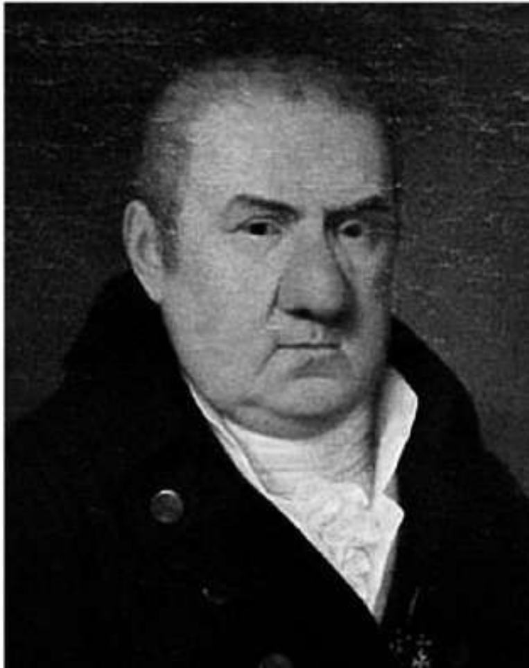
Джакомо Антонио Доменико Кваренги