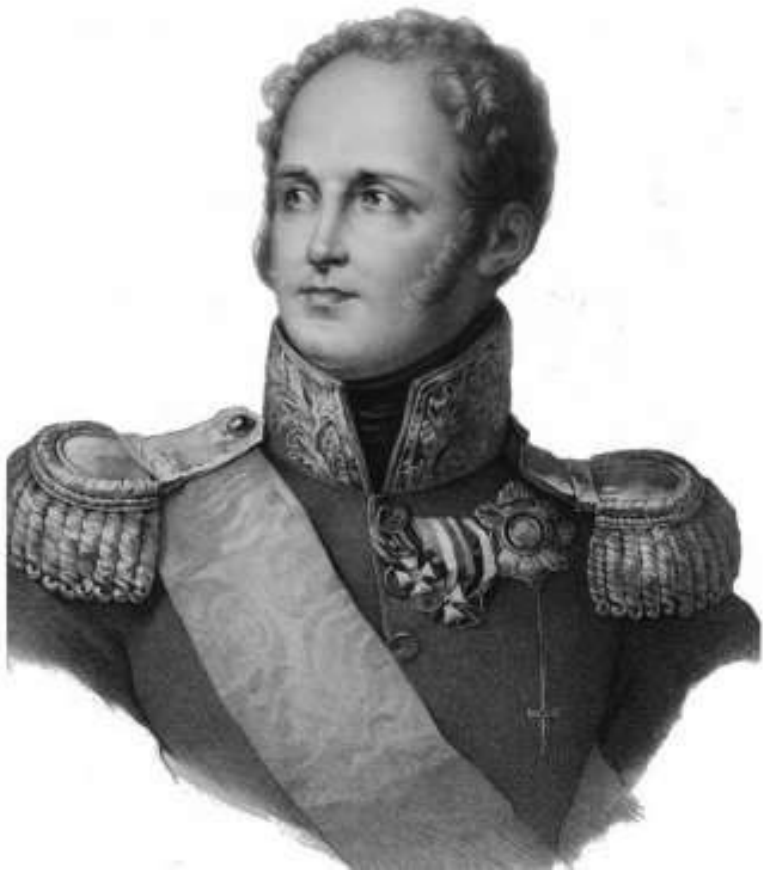
Император Всероссийский Александр I (Благословенный) В 1803 году граф с помощью верного помощника Ма-