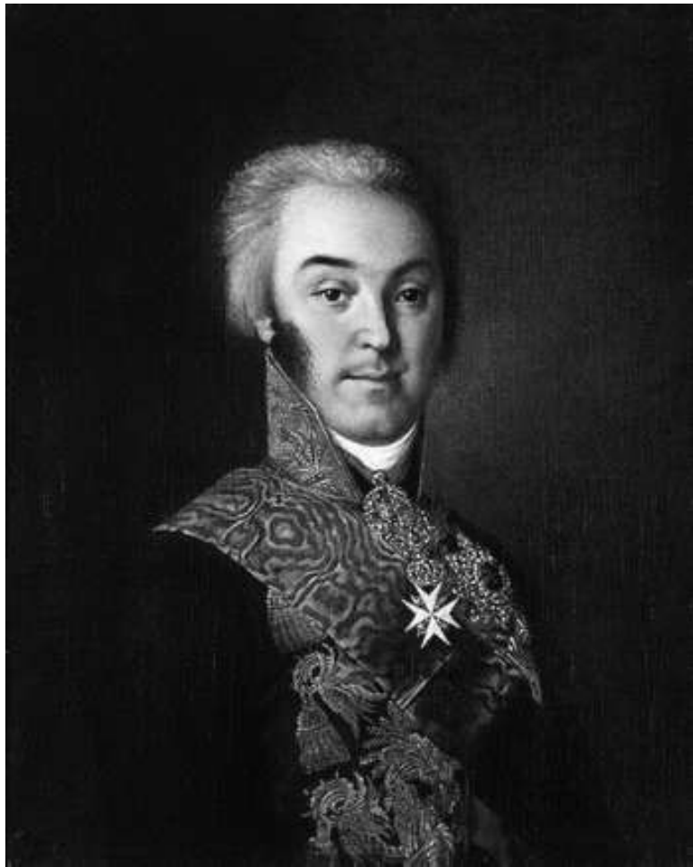
Граф Николай Петрович Шереметев