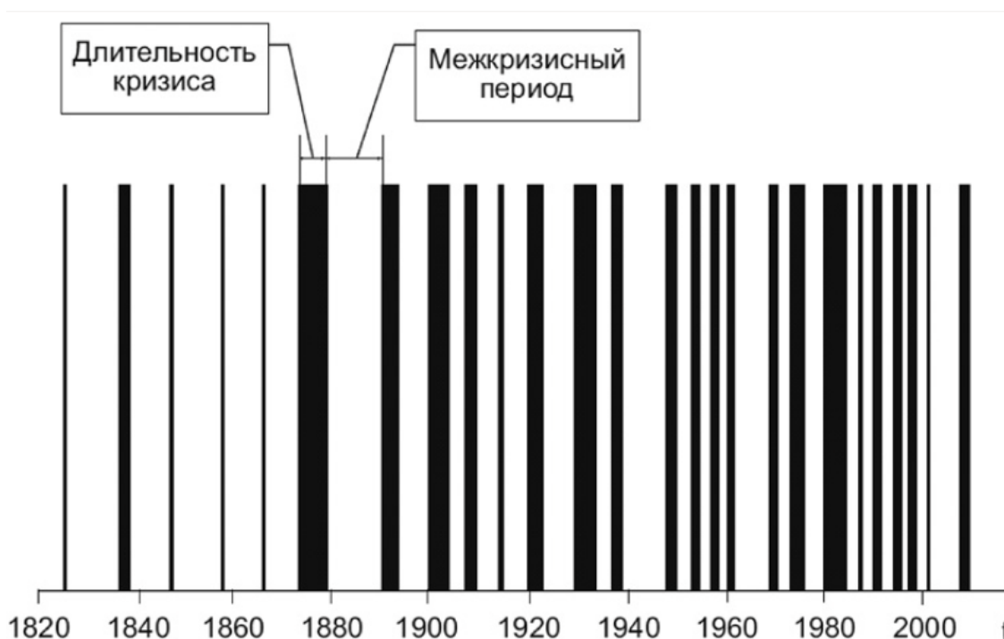
Рис. 10. Финансовые кризисы в истории мира

Современные финансовые и фондовые рынки из инструмента содействия развитию мирового хозяйства превратились в дестабилизирующий фактор, в глобальное приватизированное казино, в «грыжу» реальной экономики. Появились целые группы людей и профессий, которые за баснословно крупные гонорары раскручивают рулетку этого казино, не участвуя в процессе производства общественно полезных товаров либо услуг. На приведенном ниже графике видно изменение частоты кризисных явлений в финансово-экономической жизни мирового сообщества.