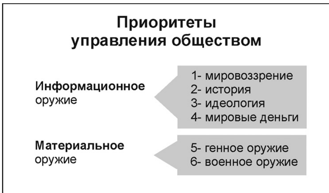
Рис. 3. Приоритеты управления обществом

Уровень государственного управления (законодательная, исполнительная и судебная власти) всегда с неизбежностью замкнут на чужую концептуальную власть, если не опирается на свою собственную. В последующем материале каждый из приоритетов будет рассмотрен отдельно. Пока же отметим, что наиболее яркой иллюстрацией мощи их одновременного применения является операция по уничтожению государственности Советского Союза. Силой военного оружия уничтожить СССР не удалось, но это было сделано без единого выстрела средствами более высоких приоритетов.