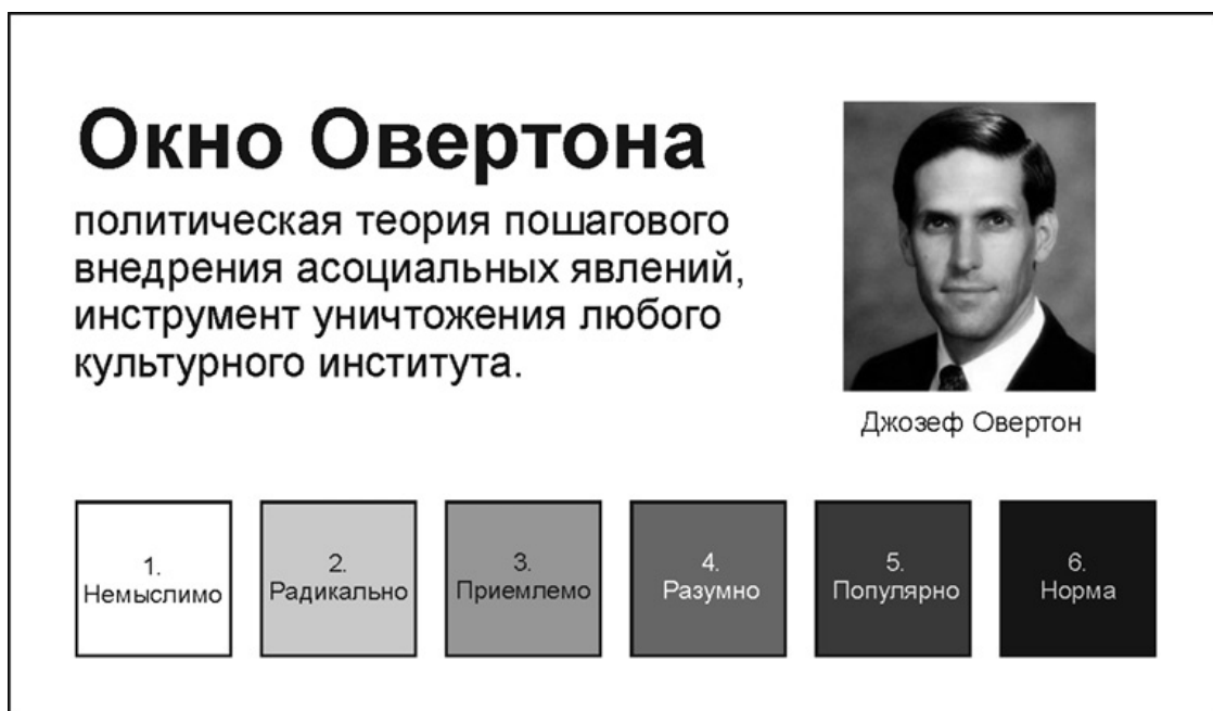
Рис. 2. Этапы перехода общественного сознания от немыслимого к нормальному

Тем же способом возможен перевод общественного сознания в русло жизни в соответствии с Божьим промыслом. Уклонения от Божьего промысла многовариантны, а под достижение любой из этих порочных целей формируется собственная интеллектуальноемкая «наука». К примеру, экономика сбережения коренного населения практически по каждому вопросу будет давать прямо противоположные рекомендации по отношению к столь же научно обоснованной экономике зачистки территории от аборигенов. Представьте себе, для примера, законы, включая экономические, обычаи и нравы в государстве, живущем по принципу: «После нас хоть потоп». А потом сопоставьте их с концептуально иной государственностью: «Сохраним и приумножим все для наших потомков». И вы поймете, что любой закон является лишь следствием тех или иных нравственных устоев общества, а, следовательно, законодательную власть нельзя рассматривать как самодостаточную, как первоисточник властных функций государства. Абсолютизация норм закона – верный путь к катастрофе государственности и культуры, если законы порочны и безнравственны. Сам смысл жизни и цели Бытия при различном мировоззрении, при различных концепциях, господствующих в обществе в силу их различной нравственной обусловленности, воспринимаются по-разному.