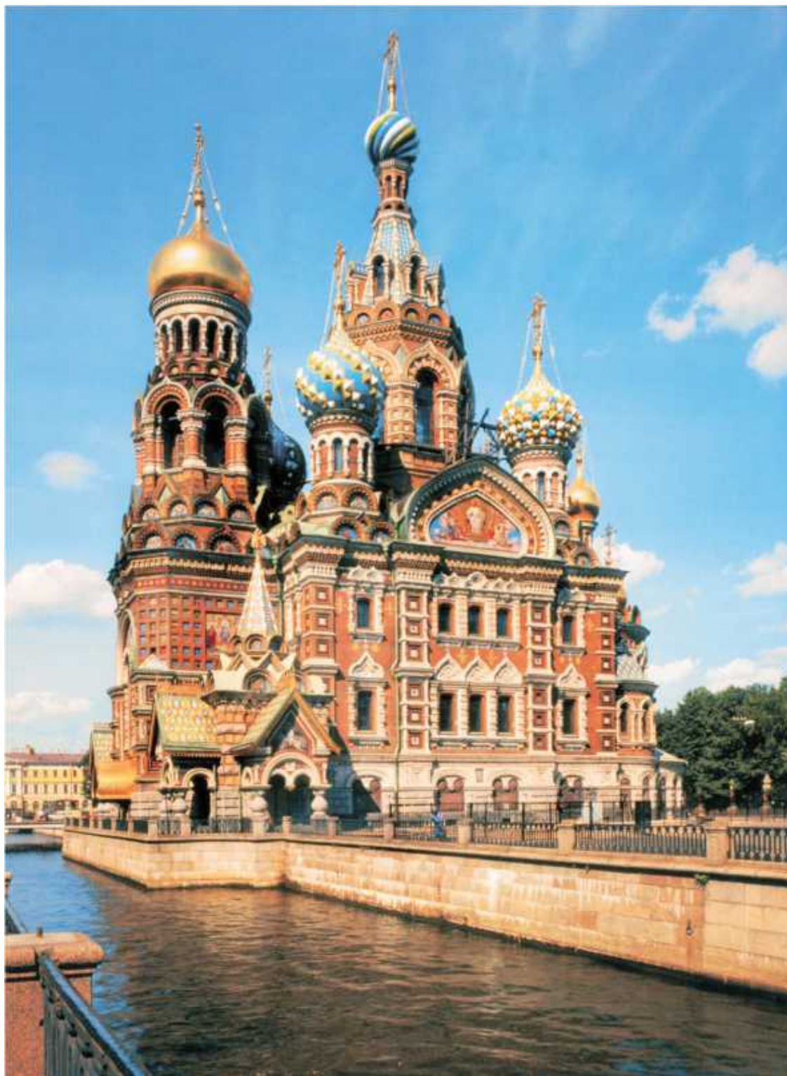
Адольф Парланд Храм Воскресения Христова (Спас на Крови) на месте покушения на Александра II в Санкт-Петербурге