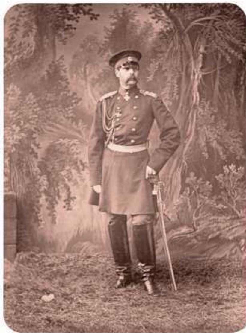
Император Александр II 1860-е

Что касается внешней политики Александра II, то историки обоснованно относят к его заслугам возврат Россией прав на Черное море и территорию Бессарабии, присоединение Батума и турецкого Карса, освобождение балканских христиан от османского ига и т. д.