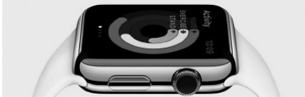
Рис. 1.2. Исходное (а) и пересмотренное (б) позиционирование Apple Watch

Apple Watch предоставляет вам полную картину вашей повседневной физической активности, поскольку измеряет не только количество ваших движений (например, пройденных шагов), но и их качество и частоту. Три кольца приложения Activity наглядно отображают ваш прогресс и дают вам мотивацию для того, чтобы вы меньше сидели, больше двигались и получали физическую нагрузку. Отдельное приложение Workout предназначено для специальных кардиотренировок. Со временем Apple Watch изучает то, как вы двигаетесь, и может предлагать персонализированные ежедневные цели и поощрять их достижение. Поэтому ваши дни могут стать лучше, а жизнь — здоровее.