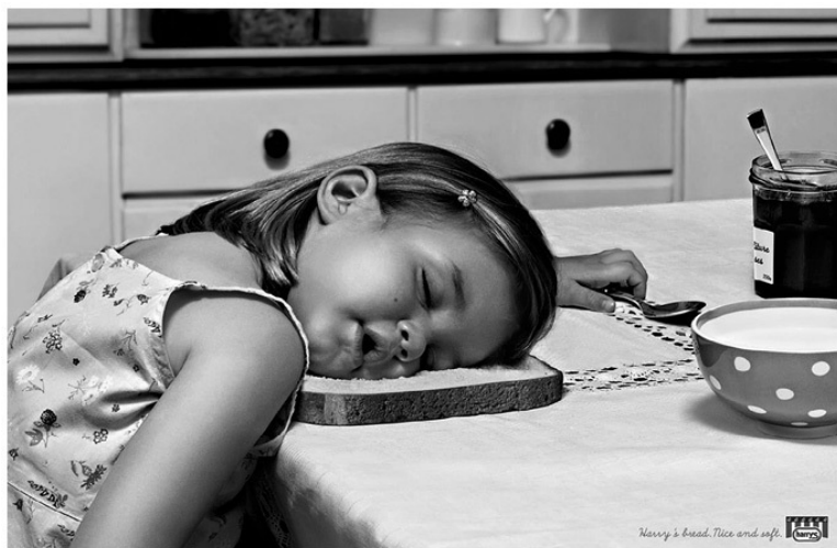
Рис. 1.1. Основание для доверия

ют нишевую выгоду (после Gain одежда пахнет свежестью). Причастность бренда к преимуществу усиливается, когда это подтверждается основанием для доверия – конкретным доказательством, придающим правдоподобность утверждению о преимуществе. Основанием верить, что Apple сделает потребителя умнее, стала линейка передовых продуктов, которые производит компания, – iPod, iPhone, iPad и компьютеры Macintosh. А основанием верить в то, что хлеб Harry's «милый и мягкий», – изображение дремлющего ребенка, положившего голову на хлеб (рис. 1.1).